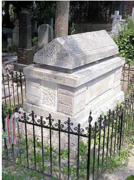
6. ábra: Tótfalusi Kis Miklós sírja Házsongárdon

Véleményem szerint kijelenthetjük, az erdélyi tipográfus-művész, Tótfalusi Kis Miklós a betű három évszázados átalakulásában döntő és megkérdőjelezhetetlen szerepet játszott.