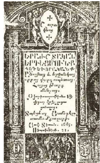
5. ábra: Örmény és grúz betűs kevert szedés

Mesterünk ökonomikus törekvéseiről fentebb már esett szó, ez pedig szorosán érinti a könyvek méretét és alakját. Ebben az időben a papírméretetek még nem voltak egységesek, sőt, a nyomtatványokat könyvkötők kötötték könyvvé, így saját ízlésük szerint vágták méretre az oldalakat, ezzel eltörölve egy nagyon fontos elemet, a tipográfus eredeti oldalarányait. Ennek ellenére Kis kevés, összesen 6 szabott formátummal dolgozott. Kisded formának a 24-edrét, 18-adrét és 12-edrét könyvecskéit nevezi, ezek általában gyakran forgatott, fontos műveket tartalmaztak. Házi papíralakja valószínűleg a „kis jegyzet” lehetett, amelynek mérete 34/35 X 44 vagy 33 X 42 cm. Ennek 12-edrétjét nevezi „kis formának”, ilyen alakban többnyire