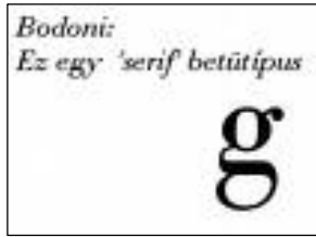
2. ábra: Bodoni betűje

A kalligrafikus formákat szerkeszthető, mértani jegyek váltják fel, eltűnnek a tollvonás sajátosságaiból adódó formajegyek. Ennek megfelelően a kezdő és befejező vonalak kiegyenesednek, a betűtálpak egyenes vonalakká válnak, a kerek betűk ferde