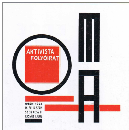
4. kép A Ma 1924-ben. Forrás: Kassák Lajos; Reklám és modern tipográfia . Kassák Múzeum, Bp. 37.

irat hátlapjára került a szerkesztő és a kiadó megnevezésével együtt; néhol maga a „tartalom” szó iniciálészerűen lett süllyesztve a folyó szövegbe. A képeket a szövegbe süllyesztve helyezték el az oldalon. Az azt körülvevő szegély a képszéltől