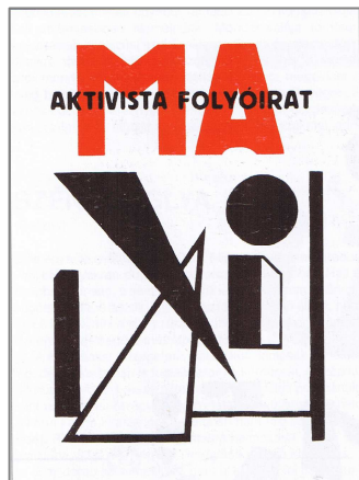
3. kép A Ma 1921-ben.

ráfiai külsőt mutatott. A címlapon kezdetben a cím még kézi rajzolású, nagybetűs, vaskos betűkből állt, s alatta egyetlen egészen széles, fekete, vízszintes lénia húzódott (2. kép). Az alcím ez alatt helyezkedett el; betűi talpas, verzál és kövéren szedett antik-