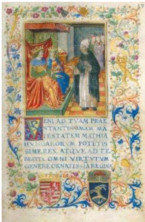
6. kép. Gazdagon díszített oldal egy korvinából

tipográfiára, hogy a vesszőket és szóközoeket akkor és úgy használták, hogy a szöveg a szemnek tetszően legyen kialakítva. Ennek érdekében alkalmazták előszeretettel a már korábban említett oldaltükröt, valamint a szöveget úgy igazították a kötéshez, hogy az megfeleljen az aranymetszés szabályának.