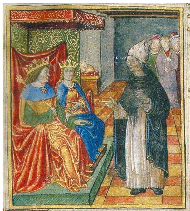
7. kép. A királyi pár fogadja Ransanus

Nem véletlenül választottam témának a Bibliotheca Corvina kódexeit, hiszen több évtized távlatában vizsgálódva még érdekesebbnek hat számomra ez a téma. A reneszánsz kor, az udvari fényűzés, a művészi szépségű kódexek mind lenyűgözik napjaink emberét, hiszen manuális úton készült kódexeknél nem csak a szövegek betűit festették kézzel, hanem az indás körzeteket, a gazdagon díszített iníciálékat és az illusztrációkat is. Ez kissé talán felfoghatatlan is lehet a mai digitalizált világunkban, ahol ha leveszünk egy könyvet a polcról, akkor – a korvinákhoz képest – csupán egy nyomdai kiadványt, egy automatikusan legyártott művet tarthatunk a kezünkben. Ahogy láthatunk a reneszánsz tipográfia sokban különbözik a mai normáktól. Nem csak külsőségbeli, hanem funkcionalitásbeli különbségeket is felfedezhetünk. A kor kódexeit is összevethetjük egymással. A lapok indás fonatai hol egyszerűbbek, hol bonyolultabbak, az iníciálék hol kisebb, hol nagyobb sormagasságúak. Ám nem is kell, hogy egyformán díszítettek legyenek, hiszen minden egyes korvina önálló értéket képvisel, mindegyik páratlan darab a reneszánsz kor öröksége.