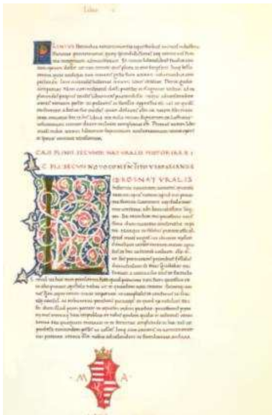
4. kép. Egy korvina kódex lapja

Ha megtekintünk egy korvina kódexet egyből szembeütik, hogy a kenyérbetűk sorkizártan vannak elhelyezve, bár nem ritka a szövegek ék, vagy egyéb alakba futó befejezése sem, amely közkedvelt díszítőelem volt a reneszánszban. A betűtípus reneszánsz antikva, a betűk távolsága a megszokottnál nagyobb, a kiemelések és címek pedig versal megoldással szerepelnek. Nem ritka az őrszó használata, amely mindig a lap alján a következő oldal első szava. Ez szintén a reneszánsz kori könyvkészítés leleményessége, hiszen így a megelőzhető volt a később darabjaira hullott könyvek oldalainak összekeverése. A reneszánsz antikva esetében, főként a kézzel írott kódexeknél, s így a korvináknál is megfigyelhető a ligatúrák használata. Mivel a betűk némely esetekben túl közel kerültek egymáshoz, így például az f mellett megjelenő i pontja zavaróan közel került az előző lenyúló szárához. Ennek orvoslására alakították ki ezt az eljárást a nyomtatott betűk körében is, melynek köszönhetően az egymást zavaró betűk egy jellé olvadtak. Ez azonban nem csak az fi betűkapcsolat esetén volt szükséges. Gutenberg a korban több száz ligatúrát használt az egyszerűsítés érdekében, melyek használata a Bibliotheca Corvina könyveitől sem volt idegen (habár