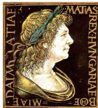
1. kép. Mátyás király babérmázas portréja

Az egyik legfontosabb alaknak Vitéz Jánost tekinthetjük, hiszen a II. Pál pápához intézett követségi feladatát könyvbeszerzésekre is felhasználta.