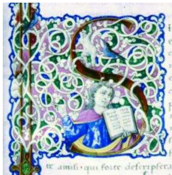
5. kép. Díszes iniciálé egy korvina kódexből

Ahogy az eddigi képeken is megfigyelhettük, viszonylag nagyok a sotávolságok, ám a szóközök annál kisebbek. Különösen jellemző a reneszánsz