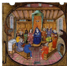
3. kép. S iniciálé: Mária és az apostolok

A kézzel írt korvinák egy hasábosak, ahogy a korabeli reneszánsz könyvekre, úgy ezekre a kódexekre is érvényes az oldaltükör használata. Érdekes, hogy akkoriban a könyvek lapjait úgy szerkesztették meg, és a szöveget úgy helyezték el rajta, hogy az összefűzéssel ellentétes oldalon nagyobb üres rész, szélesebb margó legyen. Ez egy nagyon ésszerű megoldás volt, hiszen a könyvek állandó használata miatt a szélük sérült a lapozásnál, ám a szöveg mindig sértetlen és látható maradt (4. kép). A lapok anyaga főként pergamen volt, hiszen ez a fából készült papírral ellentétben nem töredezett olyan könnyen.