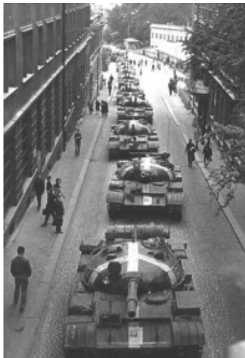
2. kép. A szovjet tankok bevonulása

A Varsói Szerződés csapatainak Prágába való bevonulásáról nem véletlenül nem került nyilvánosságra egyetlen fotó sem a magyar hírlapokban. A felvételek ugyanis minden bizonnyal a tizenkét évvel azelőtt lejátszódó budapesti eseményeket idézték volna fel (2. kép).