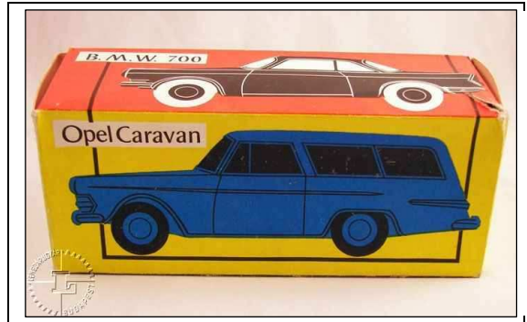
2 ábra. Opel Caravan és B.M.W. 700.

Mind két doboz esetében az eddig nem említett doboz két oldal lemeze fehér, homogén. A talplemezen csupán egy dátumbélyegző van jelen, bár némely esetekben ez elmarad és a doboz belső falára ütik rá. A használati utasítás itt is még kis méretű és csakúgy, mint korábbiakban, doboz belsejében található. Nyomtatási és kinézeti változásokat nem találni rajta az előző évtizedhez képest.