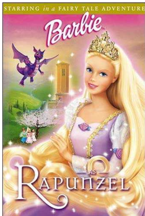
5.ábra, Barbie.

Vagy egy másik véglet a modern, korunk teljes high-tech világát magán hordozó modern és desing királynők csomagolásai, hol minden a felnőtt társadalom mintáján alapul.