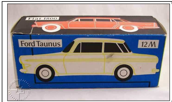
1. ábra. Ford Taurus és Fiat 1800.

darabokat csak egyszerű hullámkartonból készített, kissé talán a mai cipős dobozokhoz hasonló, külső felírás nélküli csomagolásba helyeztek. Belül különálló papíron szerepelt a rendkívül rövid, lényegre törő használati utasítás, amely talpas, lineáris betűtípusokból áll, rendkívül nagy betű közötti hézagokkal és jól elkülöníthető, nagy sortávolságú sorokkal szedett. Írásképe leginkább az írógépekkel írt szöveghez hasonlítható. A csomagolási dátum is feltűnik a doboz belső oldalán, indigókék színnel, mely a megjelenése alapján egyszerű, tekerős dátumbélyegzőtől származik. Egyébként ez a dátummegjelölés illetve dátumbélyegzési forma egészen a kilencvenes évekig, tehát a gyár bezárásáig megmarad. A hatvanas évek már változásokat hoztak. A következőkben erre láthatunk példákat.