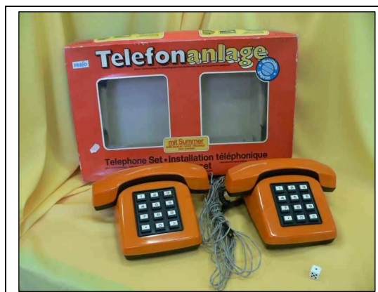
4 ábra. Telefon.

De lássuk a konkrét keleti blokkos példát. (4. ábra) A játék doboza áttört, így már nem csak képről ismerhetjük meg magát a tartalmat. A játék neve a vörös háttérből kiemelten, fehér és részben sárga groteszk (sans serif) betűvel van szedve, melyek mindkét esetben árnyékoltak. A fehérrel szedett rész fekete árnyékolást, míg a sárgán írt rész fehér vetületet kapott. A főcím alatt apró betűvel vett rész látható, szintén groteszk, de vékonyvonalú betűkből. A doboz jobb oldalán a cím utolsó betűjébe lógva egy kék körembléma található, melyen a betűk körben futnak végig. A bal sarokban egy fehér négyzetben a gyártó logóját láthatjuk.