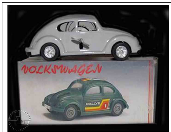
3. ábra. Volkswagen.

Tehát jól láthatjuk a közel tizenöt éves időintervallum milyen nagyfokúan befolyásolta a játékok polcokra helyező csomagolóipart. De vajon a gyerekek vagy a szülők igényei is ilyen nagyot változtak volna e kis idő alatt? A külföldi, szépen és esztétikusan megjelenített termékek megjelenése a hazai polcokon, mindenképpen hatást gyakorolt a magyar termékek csomagolásaira.