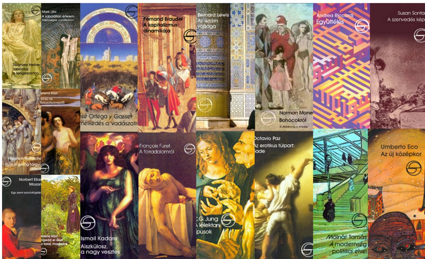
4. kép. Kollázs a kötetekből.