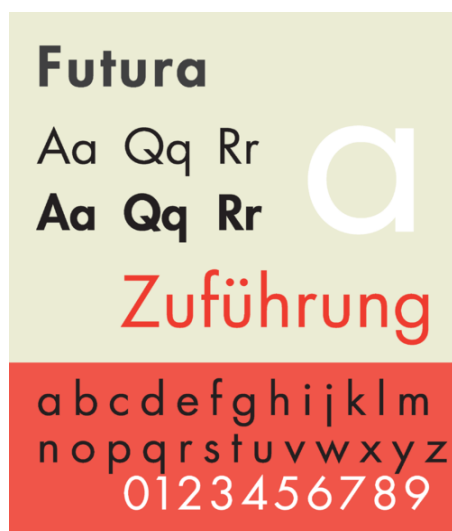
3. kép. Futura betűtípus.

kapcsolódik, hogy eredetileg a sorozatkészítők célja az volt, hogy rövid -100 oldalnál nem több-, témájában modern szerzők könyveit jelentessék meg. Ezt a sans serif betűtípust Paul Renner, a Bauhaus mozgalomtól inspirálódva, 1927-ben tervezte. „Ellentétben a korábbi sans-serif betűtípusokkal, a vonások tökéletes mértani formák, főleg a köröknél látható ez. A Futura az 50-es és 60-as években volt a legnépszerűbb és a mai napig a Volkswagen céges terveiben használt betűtípus. Stanley Kubrick filmrendező is többnyire ezt használta a filmjei reklámjainál és címsorainál (Wikipédia 2009b) (3.kép).”