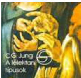
1. kép. A Mérleg sorozat emblémája.