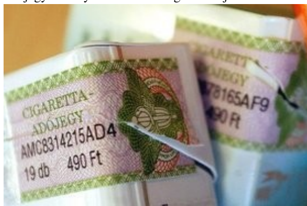
7. kép. Használt dohányzárjegek (Google)

A korszerű biztonsági intézkedések (hologram, UV-fény, vonalkód) már nem teszik szükségessé a speciális grafika és tipográfia használatát, ami annak idején különös odafigyelést igényelt és amit máig megőriztek a bankjegyek bonyolult és különleges külsejei.