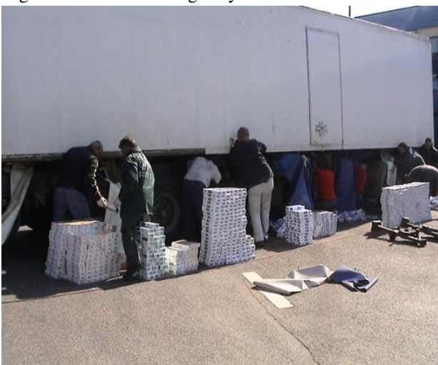
7. kép. Csempészáru leleplezése (VPOP 2005)

1936-tól 1945-ig az aszúk lepalackozását a Földművelésügyi Minisztérium engedélyezte és az Országos Borminősítő Intézet vizsgálta be, így csak az állam által előírt és ellenőrzött bor kerülhetett piacra (5. kép). Az 1923-1925-ös évjárat után készült aszú, amely nem védett pőalackban van és nincs rajta ellenőrző jegy, bizonytalan eredetűnek számít (ami nem jelent hamisat). Sok ilyen palack létezik, mert nagyon nehéz volt megszerezni az állami engedélyt.