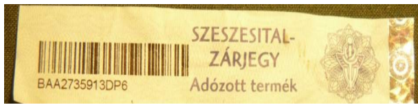
2. kép. szeszesital zárjegy

igazolja, hogy az alkoholtermék belföldi forgalom számára való vámkezelése megtörtént.” (VPOP 2005)