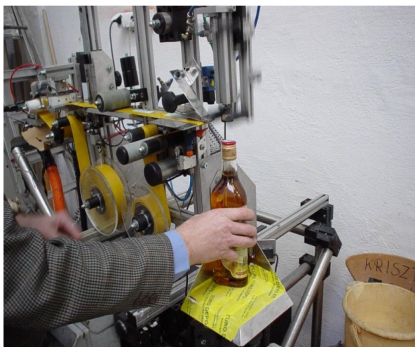
3. kép. Zárjegyző gép (Propack kft. ?)

A VPOP zárjegye fektetett téglalap alakú, színe zöldeskék. Legnagyobb felirata: „Szeszesital-zárjegy”, tintakék kontrasztos verzál betűkkel, amik azonban kicsit