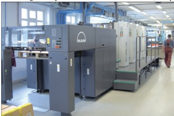
1. kép. Az Állami Pénzjegynyomda egyik terme

Az adó- és zárjegyeket Magyar Állam állítja elő és a vámhatóság bocsátja a kereskedők rendelkezésére (1. kép).