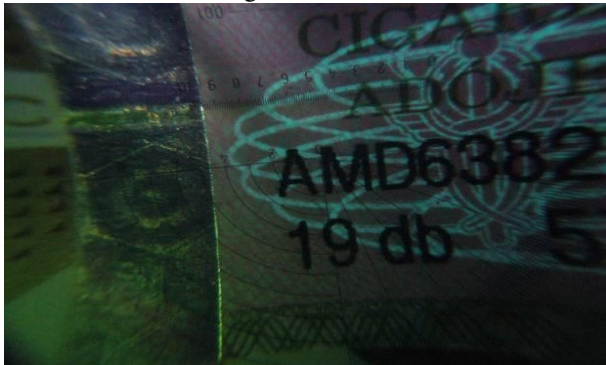
6. kép. UV fény alatt előtűnő Merkúr-embléma (VPOP 2005)

Az ún. Állami Ellenőrzőjegy a palackok nyakára kerül, jól láthatóan biztosítva a vásárlót az ital eredetiségéről. Ez különösen a méltán világhírű Tokaji boraink esetében fontos, aminek nevével nemcsak Magyarországon, de külföldön is számos forgalmazó él vissza.