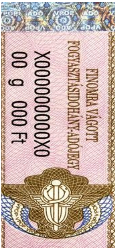
9. kép- Finomra vágott fogyasztásidohány-adójege (VPOP 2005)

A modern technika (UV-fény) mellett azonban még mindig fontos tényező a betűk vizsgálata. Egy nyomozás jegyzőkönyvében pl. ezt olvashatjuk: „az UV lámpával történt megvilágítás kimutatta a színes jelzőrostok hiányát, a papír fehér színű világítását és a betűk elmosódottságát, mint a hamisításra utaló jeleket” ( dr. Schilling Rezső: Az állampolgári jogok országgyűlési biztosának jelentése. OBH 2001). Ezért is fontos a betűk pontos nyomtatása és alakjuknak egyszerű felismerhetősége.