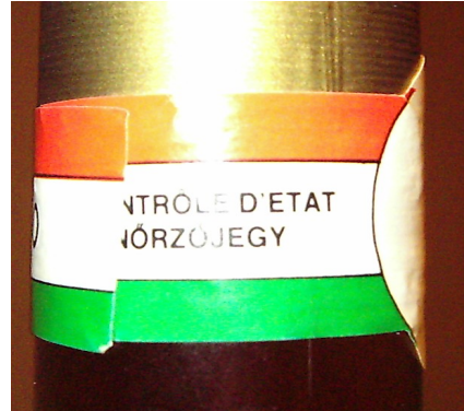
4. kép. Manapság használatban lévő Állami ellenőrzőjegy

szerint ez a betűtípus sokat ront a komolynak szánt esztétikai megjelenésen. További feliratok a csomagolási egységen lévő mennyiség (literben), az alkoholtartalom és a zárjegy sorszáma (egyszer háromkarakteres és egyszer kétkarakteres betűjelből és nyolc számból áll) (2. kép). Ezek fekete lineális betűk (kurrens és verzál), illetve számok. Négy színnel nyomtatják, ebből az egyik csak UV-fényre reagál.