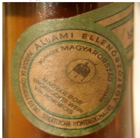
5. kép. Régi Állami Ellenőrző jegy egy Tokaji nyakán (Vigbor.hu 1999)

Létezik a zárjegyeknek egy nem sztenderdizált változata, amely leginkább az eredetiség igazolását szolgálja, tulajdonképpen egyfajta védjegy. Ezek az itthon előállított borokra kerülnek, (amik egyébként 2005 júliusa óta szintén zárjegykötelesek).