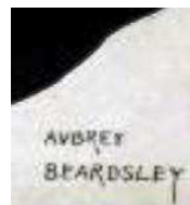
8.kép. A.B. szignója. Kép:Golfozó nők c. kép képkivágása.

poszteren már más a szignó. Maga Beardsley japanszk logónak, „trade marknak” nevezte kézjegyét. Feltehetően ezt a japán és a perzsa kalligráfia inspirálta. Jellegzetes v-alakú U betűje, valamint beardsley-s R betű, a hosszított szárral (7.kép).