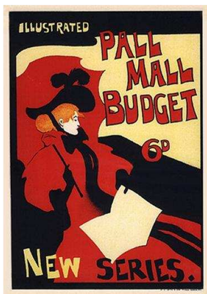
5. kép. Maurice William Greiffenhagen: Illustration for Pall Mall Magazine, 1894. Kép: www.art.com.

(4. kép) William Nicholson, David Hallen, Hyland Ellys a plakátművészet mesterei Nagy-Britanniában (Champigneulle 1978).”