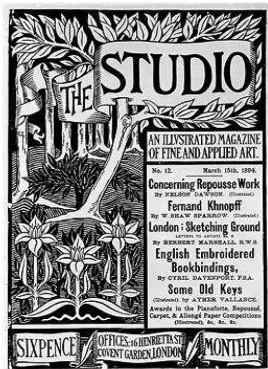
3. kép. Aubrey Beardsley: The Studio, 1893.

kontraszthatása, az aprólékos, ékszerszerű kidolgozottság, a finomság, a vonalkultúra egyedisége. Leghíresebb munkái az Oscar Wilde Saloméjának illusztrációi és az úgynevezett Yellow Book kiadvány képei (Wikipédia 2009b). Ennek a folyóiratnak már 22 évesen művészeti szerkesztője, egyben az új művészet, az art nouveau támogatója. Beardsley tervezte minden szám borítóját. Ezzel is támogatva azt az új felfogást, az Arts and Crafts mozgalom egyik fő gondolatát, melyszerint a kézi eljárások sokkal nagyobb művészeti értékkel bírnak.