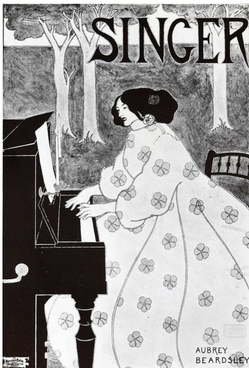
7. kép. Aubrey Beardsley: Singer varrógép plakátja, 1895.