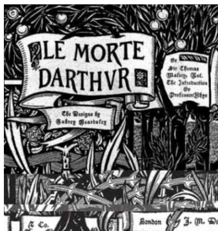
2. kép. Beardsley: Arthur halála c. mű borítója, 1893-94.

1893-ban megalakul a The Studio nevű lap, mely a kor művészeti fejlődésének legfőbb forrásává válik. A sötétzöld címlapot Beardsley tervezi (3. kép) és az első szám központi témája Joseph Penell cikke: Az új illusztrátor: Aubrey Beardsley (Brophy1976). Előszeretettel nyúlt mitológiai-bibliai és történelmi-misztikus témákhoz. A képei többsége tussal készült, jellemzik a nagy fekete területek és a papír űrjének