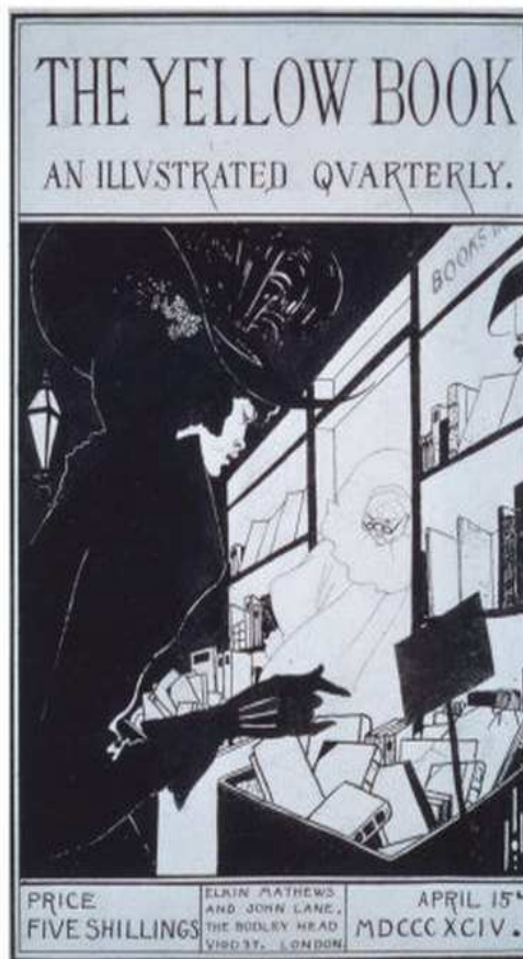
4. kép. Aubrey Beardsley: The Yellow Book, 1894.

Beardsley vonalas művészetének, választékos stílusának óriási hatása volt egész Európára (Champigneulle 1978).”