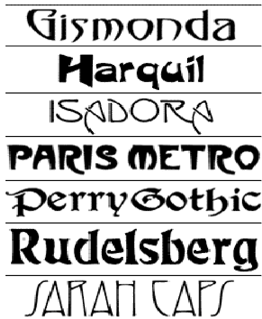
1. kép. Szecessziós antikva.

kiadó megbízta Malory Arthur halála (Le Morte Darthur) című műve új kiadásának illusztrálásával. (2. kép) Ezekre jellemzőek az „orsószerűen megnyúlt alakok, biztos kézzel, tökéletesen megrajzolva, tökéletesen mesterkélten florális kompozícióban (Champigneulle:1978).”