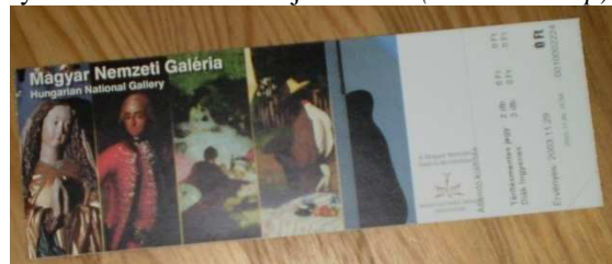
7. kép. A Nemzeti Galéria egy korábbi belépője.

Régebben (2004-ben) azonban nem volt ilyen egyszerű a galéria belépője. A Szépművészeti Múzeumhoz hasonlóan az állandó részen 5 kép volt látható az állandó kiállítás képtáraiból egy-egy kép. Képviselve van a középkori, a késő reneszánsz és barokk, a 19. századi, a 20. századi és az 1945 utáni művészet képtára (MNG 2010). A képek előtt a belépő bal felső sarkába fel van írva, hogy Magyar Nemzeti Galéria fehér betűkkel, alatta angolul, kisebb betűkkel. A képektől jobbra a galéria emblémája látható. A leválasztható rész nem sokban különbözik. A belépő másik oldalán a galéria emblémája látható kék háttér előtt. Mellette sárga alapon fekete betűkkel írott szöveg van. Itt olvasható a múzeum címe, elérhetősége, nyitvatartási ideje (7. kép).