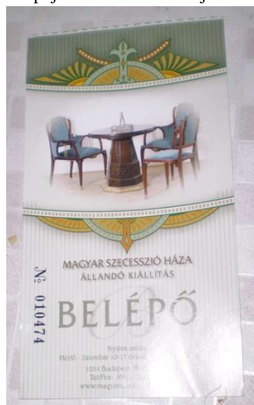
2. kép. Belépő a Magyar Szecesszió Házába. A szerző fotója.

Vannak olyan múzeumok, ahol csak állandó kiállítás van, ilyenkor sem érvényes ez az általános leírás a belépőkről. Például a Magyar Szecesszió Háza nem rendez időszaki kiállításokat, ezért a belépője már hosszú ideje változatlan (2. kép).