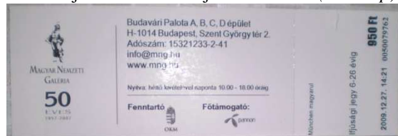
6. kép. A Nemzeti Galéria belépője.

ideje van feltüntetve. Ez alatt egy vízszintes vonal, majd a galéria fenntartójának (OKM) és főtámogatójának (Pannon) emblémája látható. Ettől jobbra van a letéphető rész, ami nagyon hasonlít a Szépművészeti Múzeum belépőjének ezen részéhez. A kiállítás címe, az arra vonatkozó információ, az ár, a dátum és egy azonosító szám látható rajta. A leválasztható rész másik oldalán a Jegymester emblémája és reklámja látható (6. kép).