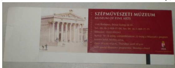
5. kép. A Szépművészeti Múzeum belépőjének hátoldala.

A belépőjegy másik oldalán látható, hogy a leválasztható rész üres, fehér. Az állandó rész hátoldalán egy akvarell kép látható a múzeumról. Ettől jobbra bordó háttér előtt fehér betűkkel van feltüntetve a többi információ. A képre merőlegesen a múzeum honlapcíme olvasható nagykapitális betűkkel ( www.szepmuveszeti.hu ). E mellett a képpel egy sorban a Szépművészeti Múzeum felirat olvasható magyarul kiskapitális betűkkel, alatta angolul, kisebb méretű nagykapitális betűkkel. Alatta a múzeum címe, elérhetősége, adószáma és nyitvatartási ideje van feltüntetve. Legalul pedig a nyitvatartási idő angolul is fel van írva, verzál betűkkel. Ettől jobbra a múzeum emblémája látható (5. kép).