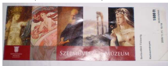
4. kép. A Szépmvészeti Múzeum belépője.

A jelenlegi (2010. január) jegyen a következő kiállítások egy-egy képe szerepel: Mítoszok földje - Gustave Moreau művészete; A nő dicsérete – Alfons Mucha, a szecesszió cseh mestere; A Szentföld öröksége – Kincsek a jeruzsálemi Izrael Múzeumból; Turner és Itália; Botticellitől Tizianóig – Az itáliai festészet két évszázadának remekművei. Ez a típusú belépő 2009. február 19 – 2010. február 14-ig van érvényben (SZMN 2010). Tehát a belépőn öt kép van, az első alatt bordó háttér előtt a múzeum fehér emblémája látható. A második kép hosszában az egész teret elfoglalja, de az alsó része sötétebb tónusú. A harmadik, negyedik és ötödik kép alatt bordó háttér elé van írva nagyméretű, fehér, kiskapitális betűkkel, hogy Szépmvészeti Múzeum (4. kép). Ez volt az állandó rész, ehhez kapcsolódik jobbról a letéphető rész, mely merőleges az állandó részre. Fehér háttér előtt fekete betűk olvashatók. A legfelső sorban a kiállítás címe (esetleg rendezvény neve, pl. Bohém bál) olvasható (a képen: Botticellitől Tizianóig), alatta az arra vonatkozó információ (Csoportos kedv. elővételi), majd az érvényesség dátuma (2009.12.02.15.00 – 16.00), és vele egy sorban az ár nagy betűkkel (1200Ft), ez alatt azonosító számok vannak, és a legalsó sorban a jegyvétel dátuma (2009.12.01. 11:52) van feltüntetve.