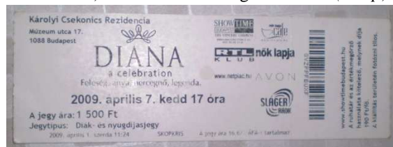
1. kép. A Diana - a celebration kiállítás belépője.

Nem minden belépőre érvényes ez az általános leírás. Előfordul olyan, hogy egy múzeumban csak számlát adnak belépőjegy gyanánt (például a pécsi Zsolnay Múzeumban). Vannak olyan kiállítások, melyeket nem múzeumban rendeznek, az ezekre érvényes belépőknek nincs állandó formájuk. Ilyen például a nemrégiben Magyarországon is látható „vándorló kiállítás” Diana hercegnőről, mely a Károlyi Csekonics Rezidencián (tehát nem múzeumban) volt látogatható (1.kép).