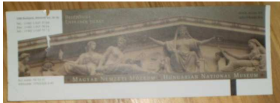
9. kép. A Nemzeti Múzeum belépőjének hátoldala.

A jegy hátoldalán a múzeum timpanonja látható: középen Pannónia megszemélyesítője egy-egy babérmagot nyújt át jobbra a tudomány és művészet, balra a történelem és hírnév megszemélyesítőinek (HMN 2010). A bal felső sarokban a múzeum címe, elérhetősége; a bal alsó sarokban az SZJ szám és az adószám szerepel. A felső sorban az elérhetőség mellett drapp háttér előtt világos, kiskapitális betűkkel ez olvasható: Belépőjegy, alatta angolul. A jobb felső sarokban fekete betűkkel a múzeum honlapcíme és e-mail címe szerepel. A kép alatt drapp háttér előtt fehér betűkkel a Magyar Nemzeti Múzeum felirat olvasható magyarul és angolul. A belépő igényes, és kifejezi, hogy a múzeum régi, nagy hagyományú és színvonalas.