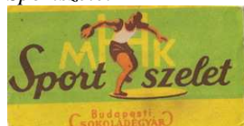
9. kép: A sportszelet címkéje

Folytatva a sort a még ma is fennálló márkanévvel, fontos megnevezni a Sportszeletet is (9. kép), amit mind a mai napig árusítanak, mint magyar specialitást. Hazánk hagyományos