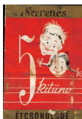
2. kép: A kitűnő csokoládé címkéje

A „kitűnő” címkéje (2. kép) piros színű, amely fajtájára utal, hiszen étcsokoládé, amely „színszimbolika” a mai napig él. Itt alul és fölül is aranszínű szalag fut, amelyeken fekete feliratok láthatók. Fent kurzívban szedve, mint egy kézírás jelenik meg a Szerencs gyártó neve, illetve lent a csokoládé fajtájának megnevezését olvashatjuk, amely sans serif, álló és verzál. Az előző címkével megegyező tipográfiájú így tartva a sorozat jelleget. A középpontban az ötös szám áll, melynek formájáról a tanuló kézírásra asszociálunk, ahogy az utána következő „kitűnő” feliratról is. Az utóbbi kurzív típusú, és mintha kisiskolás vonalazású füzetbe lenne írva. Az illusztrációk jó összhangot képeznek a számmal és az írással, mert a két mosolygós kisgyerekarc két kisiskolást reprezentál. A hátsó oldalon szintén szerepel a fogyasztási ár, ugyanolyan betűtípusban, mint a másik címke esetében.