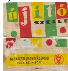
10. kép: Újító szelet címkéje

Ennek a címkének (10. kép) a külleme a szocialista designnak felel meg, ahogy az elnevezés is illik a kor „hangulatához”. A színválasztás az eddigiekhez hasonlóan a fehér alapon piros, zöld, sárga és fekete. Melyek használati cikkeken is visszaköszöttek. Az „újító” szó betűi, mintha különböző újságcikkekből lettek volna kivágva, csak egy betűtípusban. Kis színes sávokban helyezkednek el különböző színkombinációkban. Ráadásul nem egy sorban, hanem ugrálnak a betűk, amelyek minusculában íródtak, erősen kontrasztosak, talpasak (íves) és fettek. A fehér háttéren pöttyöket is láthatunk, minden páratlan betű alatt, az alapszínnel megegyezően. Ezek geometrikus formákkal a konstruktivizmus stílusát