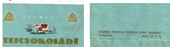
13. kép: Tejcsokoládé címke

A táblás csokoládéről eddig nem esett szó, és pont emiatt mutatnám be a Csemege gyár egyik jellegzetes tejcsokoládés tábláját (13. kép). A fajta felirata aranszínben pompázik a kék címkén. Az alsó mezőben középre igazítva helyezkedik el. Kontrasztos, sans serif, kövérített, verzál, álló, különleges betűtípusban, amelynél az ékezetek fektetettek, és a szemek feltűnően keskenyek. Az „S” betű szárai párhuzamosan futnak a tengelyt képező szárral, mely nem hagyományos stílus. A középpontban azonban a kisebb betűkkel írt gyárjelzés középre igazított és fehér színű, amely a tejsre utalhat. Ritkított betűközzel, verzálban szedett a két „csemege” logó között. Ezek annyiban térnek el az előzőektől, hogy az eredeti logó egy fehér körben található.