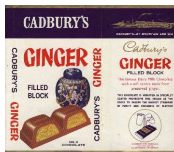
15. kép: Cadbury's csokoládécímke 60's (The chocolate wrappers 2009)

Ennek a csokoládénak nincsen fantázia neve (ahogy az előzőnek se), így az illusztrációk sem ahhoz alkalmazkodnak. Ezen megjelenik a csokoládé képe, és mivel gyömbérisítésű, és az egy köztudottan keleti fűszernövény, így egy keleties díszítésű szelence illusztrációja is látható a papíron. A feliratok nagyon változatosak. Az ízesítés felirata eltér a Cadbury's logó mindkét fajta írásától, azaz a kurzív aranytól és az álló kontrasztos verzál betűtől is. Olvashatunk a címkén, a logón és a fajtán kívül, a csomagolásról, illetve az ízesítésről szóló rövid szöveget, melyek kisebb betűméretűek és sorkizártak vagy középre igazítottak. A hátoldalon található ezek, ahol a gyártó neve és logója, ill. a tejcsokoládé hangsúlyozására készült kör alakú illusztráció is. A színek változatosak, pl.: a nyugaton gyakran megjelenő lila és arany kombináció.