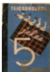
1. kép: „Jeles” csokoládécímke

asszociálhatunk, mindemellett környezetéből hangsúlyosan kiemelkedik. Elhelyezése is ehhez járul hozzá, hiszen a felső lécen kap helyet a címke elülső oldalán. A gyártó cég neve ( Szerencs ) arany folyóírás, szépen kialakított kanyargós felirat a jobb alsó sarokban. A címke alsó felét egy fehér nagyméretű, egyenes szám foglalja el, amelyet mintha a tanító/nő írta volna fel mintaként a kisdíjak számára. A fókuszban egy kockás tantermi tábla illusztrációja látható „jeles” felirattal, amit fehér krétával írtak fel a fekete, 5 madár által tartott tárgyra. Ez kurzív, kézírás imitáló gyöngybetűs írás. A hátoldalon kisebb méretű, fekete, talpas betűkkel tüntették fel a fogyasztási árat (fogy. ár: 2-Ft).