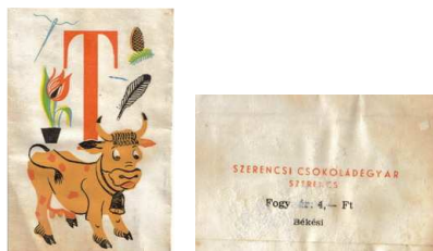
6. kép: „T” betűs címke

A „T” címke (6. kép) fehér színű, a betű élénk narancs, középre igazított és egy toll, egy tehén, egy tulipán, egy tű meg egy toboz illusztrációt láthatunk körülötte. A hátulján pedig a gyár felirata szintén narancs, a fogyasztási ár azonban fekete.