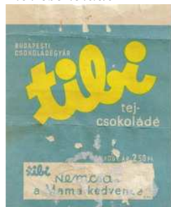
8. kép: A tibicsoki címkéje

Ennek a csokoládégyárnak a nevéhez fűződött többek között a 21. században, egy kis szünet után, a hagyományos logóval visszatérő tibi csokoládé (8. kép).