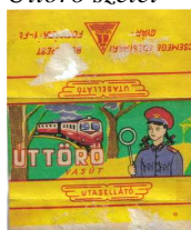
11. kép: Úttörő csokoládé címkéje

Az Utasellátó Vállalatot a Minisztertanács megbízásából 1948-ban alapította a MÁV. (Mavstart 2009). Feladata abból állt, hogy kielégítse az utazók mindenmű igényeit. Így az élelmiszer is.