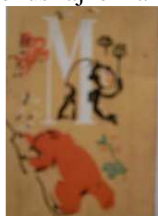
4. kép: „M” betűs címke

Az „M” betűs címkén (4. kép) a háttér és a betűk színe, mind az első, mind a hátsó oldalon megegyeznek, de az „M” a bal felső mezőben található majom, mák, málna, medve, méhecske és mókusz rajzokkal övezve.