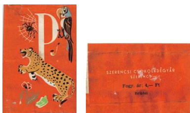
5. kép: „P” betűs címke

A „P” betű címkéje (5. kép) élénk narancs, így maga a betű fehér és középre igazítva helyezkedik el. Az ábrák szintén az előzőek koncepciójában vannak elhelyezve a betű körül. Ezek a papagáj, a pipa, a puma, a paprika, a pipacs és a pók.