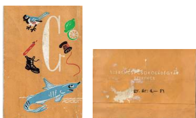
3. kép: „C” betűs címke

A „C” betű (3. kép) fehér színű és a címke jobb felső részén található különböző illusztrációkkal körülvéve, amik mind „c” kezdőbetűsek: cápa, cipő, ceruza, cinege, citrom, cérna. A hátoldalon a gyár neve fehér, a fogy. ár pedig fekete, mivel a csomagolás alapszíne halványnarancs.