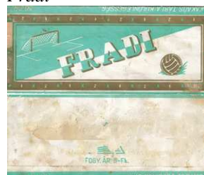
12. kép: Fradi csokoládé címkéje

A ma is létező FTC egyesület nevét viseli ez a csokoládészelet, amelynek több érdekessége is van. (12. kép)