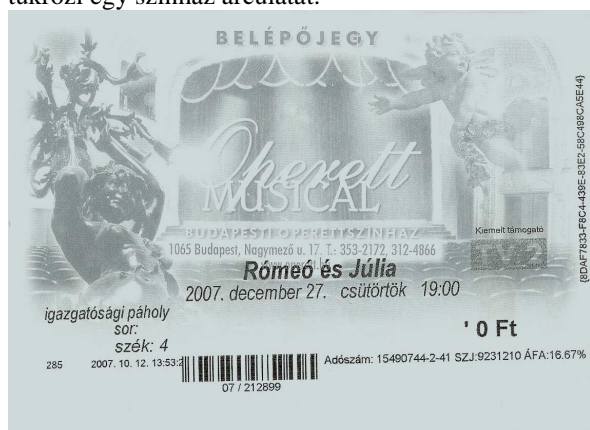
5. kép. Az Operettszínház egy belépőjegye 2007-ből

kezdéssel, enyhén fett. Utóbbi ennek ellentettje: álló, nyomtatott betűk, végig verzál és nem fett. A két szó elhelyezésével, betűtípusával és betűméretével vonja magára a figyelmet. A jegy már a konkrét előadás információi nélkül is telített, a mozgalmas háttér egyetlen sima felületén – a függönyön – pedig a stílusmegjelölések olvashatóak. Egyértelmű, hogy e koncepció szerint a legfontosabb, hogy melyik színházról van szó, nem pedig, hogy milyen darabról. Az előadás címe és időpontja, a jegy ára valamint az, hogy melyik helyre szól, nincsenek belekomponálva az összképbe. Egyszerű, fekete feliratként nyomtatják a jegyre sokszor úgy, hogy kitarolja a korábban említett információk egy részét. Az Operettszínház kítűnő példája annak, amikor a jegy teljes mértékben tükrözi egy színház arculatát.