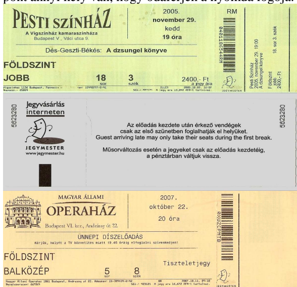
8. kép. A Magyar Állami Operaház egy belépőjegye 2007-ből és a Pesti Színház egy belépőjegye – előlről és hátulról – 2005-ből Egy emberi tulajdonságokkal felruházott, táncoló jegy rajza, alatta a – szinte olvashatatlanul kicsi – verzál, Jegymester felirat. Ugyanaz a jegy

Egyik csoport a Jegymester-garnitúra. A korábban már elemzett Víg- és Pesti Színház (8. kép) valamint a Magyar Állami Operaház (8. kép) és Erkel Színház párosok ezzel a céggel dolgoznak. A négy jegy tónusa régebben eltért egymástól. Előbbi kettő egyszínű barna, utóbbi kettő mintás sárga árnyalatú volt. 2007-re ez a különbség is elmosódott, mivel az Operaház is áttért a barnás háttérre. Ez betudható véletlen egybeesésnek, viszont van olyan tulajdonság, amiben minden e cégnél nyomtatott jegynek egyeznie kell. A letéphető ellenőrző szelvény és a nézőnél maradó rész közt egy keskeny vonalkód található, ami alatt még pont annyi hely van, hogy odaférjen a nyomda logója.