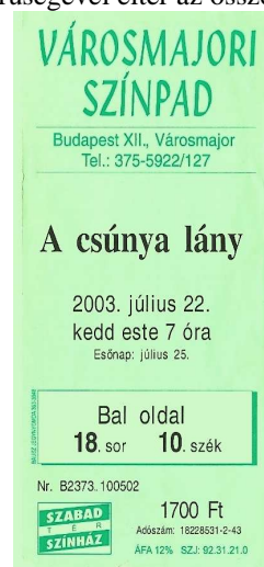
7. kép. A Városmajori Színpad egy belépőjegye 2003-ből

Ide tartozik például a Városmajori Színpad (7. kép). Bold előadáscím, minuszcula dátum, keretezett helymeghatározás. Ezek azok az általános jellemzők, amelyekkel minden színházjegyen találkozunk. Két érdekesség figyelhető meg. Egyik a jegy színe. Halványzöld háttere önmagában is egyedinek számít, de különösen fontos szerepet kap azáltal, hogy a verzál és bold színháznév is ennek a színnek egy sötétebb árnyalatával van szedve. Másik érdekesség a jegyen olvasható szövegek iránya. Közel ötvenféle belépőjegy közt ez az egyetlen, ahol a téglalap alakú papíron állítva olvashatóak az adatok. Könyvjelzőszerűségével eltér az összes többi jegytől.