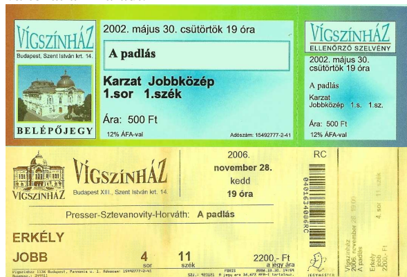
1. kép. A Vígszínház egy-egy belépőjegye 2002-ből és 2006-ból

A legkisebb változáson keresztülment eleme ezeknek a jegyeknek a logó. Verzál, antikva, eleinte Garamond, később Times New Roman. Jellegzetessége a szöveg egészének alakja, amely a szín- és elhelyezéssel módosítások ellenére is változatlan maradt.