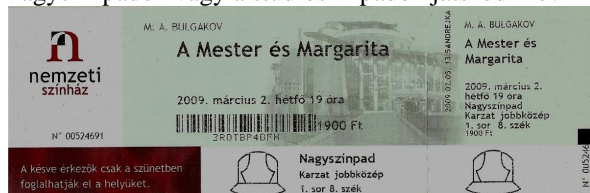
6. kép. A Nemzeti Színház egy belépőjegye 2009-ből

Más stílusban, de ugyanennyire különlegesek a Nemzeti Színház jegyei (6. kép) is. Kevésbé hangsúlyosan, de itt is megjelenik a színházról készült kép a háttérben. Ez esetben – a médiában is nagy port kavart – épület külsejét láthatjuk. Ezen kívül még egy helyen használ vizuális kifejező eszközöket a tervező: a jegy alján tüntetik fel, hogy az aktuális darab a nagyszínpadon vagy a stúdiószínpadon játszódik-e?