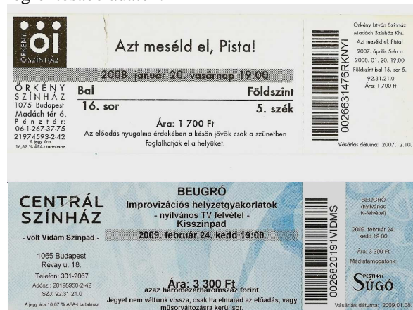
9. kép. Az Örkény István Színház és a Centrál Színház egy-egy belépőjegye 2008-ból és 2008-ból

Másik csoport az InterTicket-garnitúra. Ezek a jegyek három részre tagolódnak. Bal felső sarokban található a logó, alatta pedig a színházra vonatkozó adatok, többnyire álló, nem fett és nem kurzív betűkkel. A logó miatt mégis ez a jegy legvariábilisabb része. Középen az előadásról tudunk meg információkat. Legfelül a fettet cím olvasható. Alatta az időpont, mely egy fekete pöttyökből álló kiemelő tónussal kap külön hangsúlyt. Ezután következik a helymegjelölés, végül az árkategória. Minden sor talpatlan betűkből áll és – többnyire – középre zártan helyezkedik el. A jobb szél itt is a nézőtéri felügyelő. Egységesen kisméretű betűkkel szedve, kiemelés nélkül ismétlődnek meg a legfontosabb adatok.