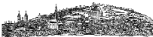
Miskolc város látképe a mészáros cég felszabadító levélén, 1834 (HOM. HTD. I. 76.30.)

Természetesen az egy-két lapos hivatalos nyomtatványok mellett Szigethy nyomdájában számos nagyobb terjedelmű munka is készült, melyek közül kiemelkedtek a halotti beszédek. Szintén fontos város-, illetve kultúrtörténeti emlékek az általa előállított színlapok. Az első ismert miskolci színlapot 1812. június 17-én adta ki Szigethy, mely német nyelvű színlap eredeti példánya megtalálható a múzeum gyűjteményében. A színlap alján a nyomdász hirdetése olvasható, melyben értesíti a „Nagy Tekintetű Nemes Publicumot”, hogy „a Könyvnyomatás Mestersége ezen Kir. Kor. Priv. Városban is elkezdődött”.