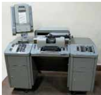
Lumitype-Photon szedőgép, Párizs, 1958