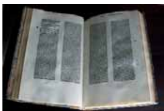
Martin Husz: Cato moralisatus , Lyon, 1480