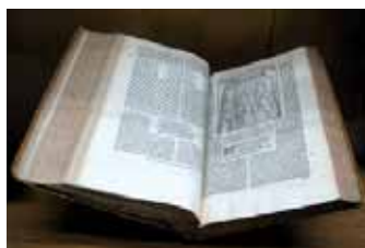
Dante-mű velencei nyomata , 1578