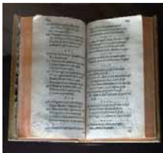
Petrarca-kötet – Guillaume Rouillé, Lyon, 1574