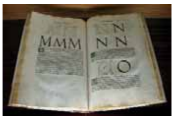
Albrecht Dürer: Quatuor his suarum Institutionum Geometricarum libris , Párizs, 1535