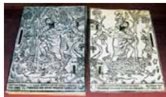
Fametszet és nyomat

A második folyosón kiállított szekciónak „A könyv és az ötlet elterjedése” címet adták a kiállítás szervezői. Számos tudományos, műszaki,