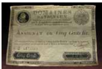
XVI. Lajos pénzjegye, 1790

vallási és egyéb munka található közöttük, többek között Diderot és d'Alembert Enciklopédiája, az igen ritka „Affaire des placards” (az 1534-es ún. kiáltvány-ügy, a 16. századi Franciaország vallási konfliktusainak kezdetét jelző esemény volt, melynek hatására I. Ferenc megkezdte a protestánsok üldözését) és többek között XVI. Lajos pénzjegyei. Itt található a nyomdászat iparizálásának 19. századi mérföldkövei, mint a stereo-