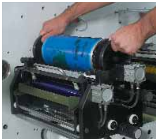
Nyomóhenger cseréje a Floweren

Újdonság az Unifit Bridge adapter sleeve is, amellyel olcsóbb rapport-sleeve -ek alkalmazhatók, anélkül, hogy az Unifit Bridge -hez külön levegőelátást kellene biztosítani.