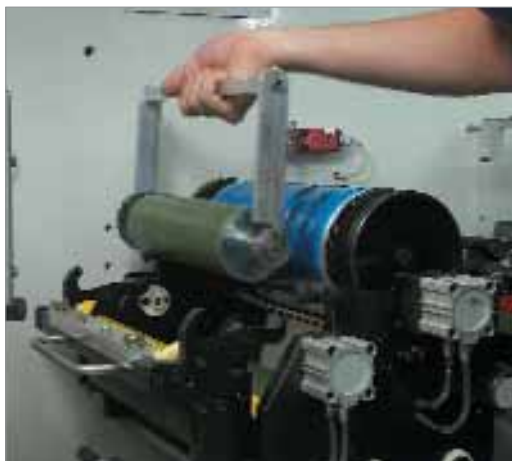
Raszterhenger cseréje a Floweren

Fehér festékeink 47–55%-os titán-dioxid-tartalommal a nyomat sokkal fehérebb, tömörebb és