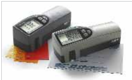
SpectroDens és SpectroPlate