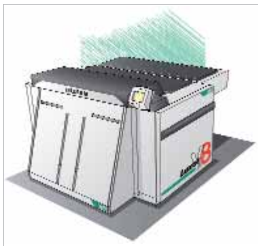
Fujifilm Luxel V8 High Definition