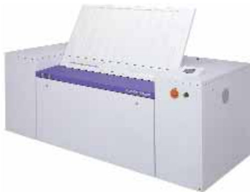
SCREEN 8200 Niagara