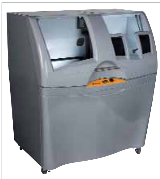
Contex Zprinter 450 kompakt színes irodai téryomtató, a gyors prototípusgyártás legújabb eszköze, megtekinthető a Digit standján

450 színes 3D nyomtató lesz. Az első irodai használatra is alkalmas téryerű nyomtató a számítógépen tervezett virtuális 3D-s modell tökéletes valós mását – egy kézzel fogható tárgyat – képes elkészíteni. Alkalmas gyors prototípuskészítésre, koncepciómodell, termékminta, öntőforma gyártására. Hasznos a véges-elem-analízis és a funkcionális tesztelés szakembereinek, de jelentős az orvosi alkalmazása is.