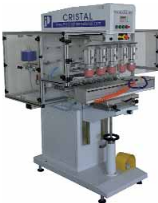
Hart Color: Cristal 135 tamponnyomó gép

koordinátaasztalok, carrészalagok, szárítók, előkezelők stb.);