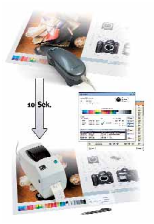
Fujifilm ProofReport csomag

A ProofReport egy egyszerű, de hatékony eszközkészlet a színellenőrző berendezések minőségének és konzisztenciájának ellenőrzéséhez, illetve jegyzőkönyveléséhez.