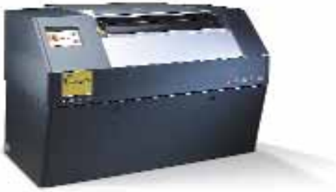
Esko CDI, a világ legelterjedtebb flexó CTP-berendezése

technológiáját, de a világszerte legelterjedtebb flexó CTP-berendezéseket, a CDI -ket is felvonultatja.