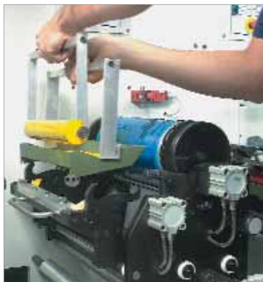
Festékezőmű cseréje a Floweren

A Hoffmann Kft. standjának középpontjában a GiDue Flower flexo nyomóműve áll. A Flower egyszerűen szétnyitható, jó hozzáférést biztosító konstrukciója a hatékony átállítás, ezzel a termelékenység záloga a keskenypályás Combat nyomógépeken. Eredményesen csökkenti a flexónyomatásra jellemző sokféle változó befolyását. Egyszerű kezelhetőségével máris iskolát teremtett a keskenypályás gépeken. Jól kombinálható más nyomtatási eljárások, például szita-, mélynyomás nyomóműveivel vagy kiegészíthető különböző fóliázási feladatokhoz.