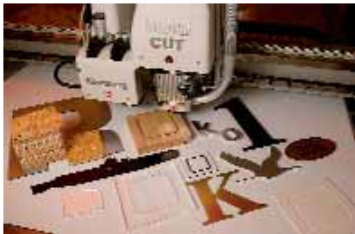
Kongsberg asztal Multicut fejfel – szinte bármely anyag digitális stancolására, mintakészítésre

A teljes flexónyomatási folyamat minden egyes fázisába betekintést nyerhetünk a Dupont kliséanyagoktól és vegyszermentes kidolgozási technológiától kezdődően a digitális lemezkészítésig, az előkészítést és munkafolyamatot támogató Esko Software Suite 7 szoftvercsomagon át a nyomtatásig és utófeldolgozásig. A nyomtatás és utófeldolgozás területén az Edale keskenypályás nyomógépeivel és a Prati áttekerceselő, ellenőrző rendszereivel találkozhatunk.