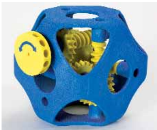
Contex színes 3D nyomtatóval készült működőképes prototípus

A bemutató talán legnagyobb szenzációja a Magyarországon most először látható Contex Zprinter