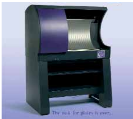
HighWater COBRA 2