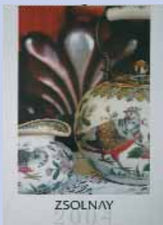
Novoprint Rt. – Zsolnay naptár