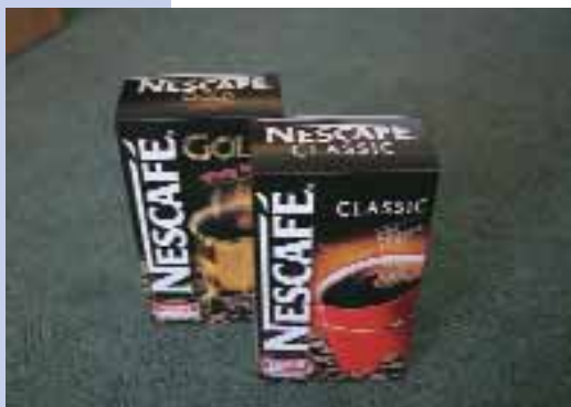
M-real Petőfi Nyomda Kft. – Nescafé Gold doboz, Nescafé Classic doboz