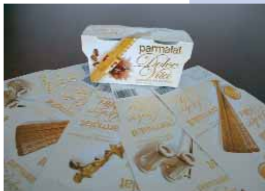
M-real Petőfi Nyomda Kft. – Parmalat doboz (3 féle)