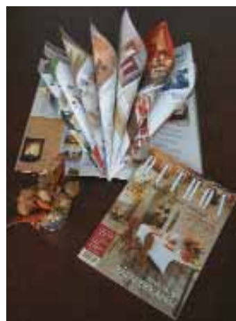
Szakra Lapnyomda Rt. – OTTHON