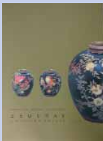
Dürer Nyomda Kft. – Zsolnay album

A díjátadó ünnepségen az arany fokozatot elért nyomdák