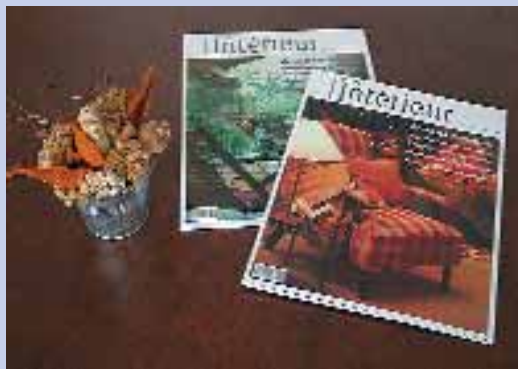
Novoprint Rt. – Intérieur magazin