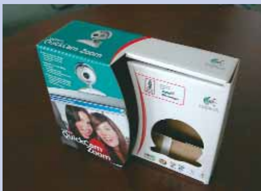
M-real Petőfi Nyomda Kft. – Logitech doboz