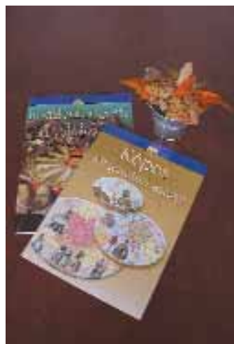
Cartographia Kft. – Irodalomtörténeti atlasz és Képes történelmi atlasz

Az ez évi verseny megrendezésének és lebonyolításának dátuma egy jelentős nemzeti eseménnyel, az Európai Unióhoz való csatlakozás jövőnket meghatározó időpontjával esett egybe. A csatlakozást követően néhány hét múlva megrendezett díjkiosztási ünnepségen méltán hangzott el az a megállapítás, miszerint a versenyre bene-