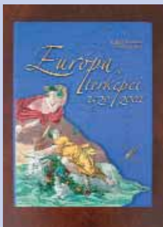
Alföldi Nyomda Rt. – Európa térképei 1520-2001

nyomdaipar egyenrangú tagként lépett az Unióba . A felvontatott produktumokban egészségesen és alkotó módon ötvöződik, jól kiegészíti egymást a hagyományos szemlélet, technológia és anyagok felhasználása, valamint a korszerű technológiák, anyagok alkalmazása.