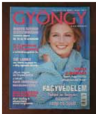
Szika Lapnyomda Rt. – GYÖNGY