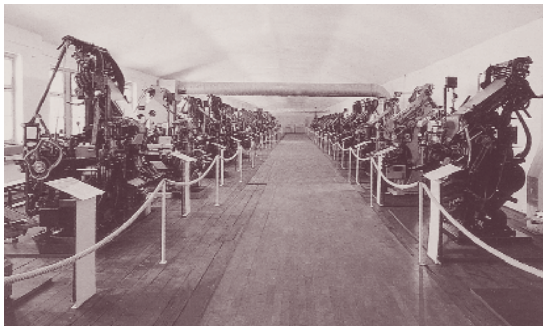
1. ábra. A schopfheimi szedőgépmúzeumban összegyűjtött gépek

megőrzött nyomdászemlékeket. Örvedetesen nemcsak idős kollégák tartoznak ide. – Nos, ezeket az egymástól elszigetelt erőket egyesíteni kellene! Kinek? Az államra nem számíthatunk, csak magunkra. Én a Papír- és Nyomdaipari Műszaki Egyesületet tartom erre a legalkalmasabbnak. Lehet ellenvetni: erre nincs kapacitása, meg nem is feladata. Biztosan így van, de vannak tettvággyal teli fiatal és nyugdíjas tagjai, akiket lelkesíteni, mozgósítani lehetne erre a feladatra. Természetesen a szervező, koordináló, időpontokat, helyszíneket szervező-összehangoló tevékenység az egyesület részéről alapvető fontosságú.