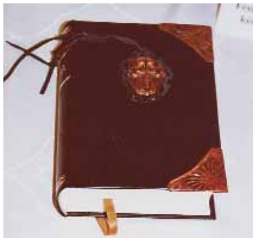
11. kép. Betáblázott kötés egészéből borításban, fémveretekkel díszítve

csoda tehát, hogy a szakmailag kiváló könyvkötő mestert a megrendelők az ország minden részéről és külföldről is felkeresik.