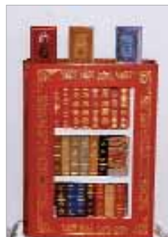
3-6. kép. Különleges kötéstípusok

2003-ban az Ipartestület küldöttgyűlésén megkapta az „Aranykoszorús Mester” címet.