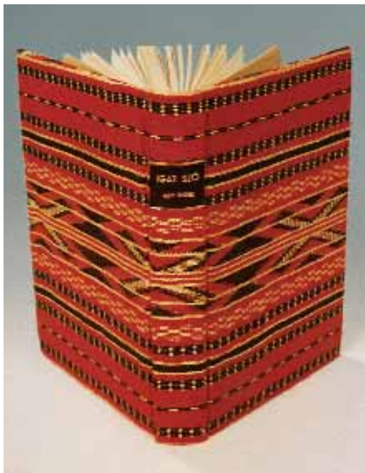
12. kép. Speciális vászonba borított könyv

Számára a szakma elsősorban ma is a kézműveséget jelenti (12. kép). Ezt a szemléletet igyekezett a nála tanuló fiataloknak is átadni. Tanulói az országos versenyek nyertesei voltak, ezt mutatja,