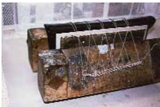
7. kép. Betáblázott kötés készítése, gerincbordák kikötése

Az Európai Örökség Napok alkalmából, az ingyenes épületlátogatási hétvégén, szeretettel várják a látogatókat a Tarapcsik Dinasztia könyvkötészetében, ahol bemutatják a különleges kötések készítésének műveleteit is (7-9. kép).