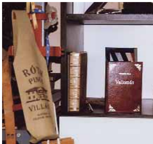
10. kép. Bőrborítású könyvek, kézi aranyozással díszítve

Mindezek csak a „jéghegy csúcsa”. Közel kétezereféle terméket készítenek a műhelyben. Nem