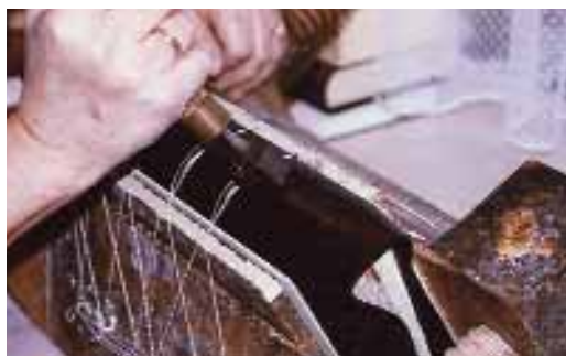
8. kép. Gerincbőr vasalása