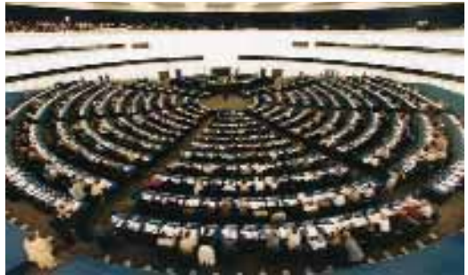
3/b ábra. Az EU strasbourgi parlamentjének ülésterme

Az Európai Parlament (EP) az Unió állampolgárai által közvetlenül választott képviselőtestület, amelynek fő feladata, hogy az Unió polgárainak az érdekeit képviselje a közösségi döntéshozatalban. Jogalkotó hatáskörrel rendelkezik. Egyelőre három helyszín között ingázva „üzemel”: a franciaországi Strasbourgban, a belgiumi Brüsszel-