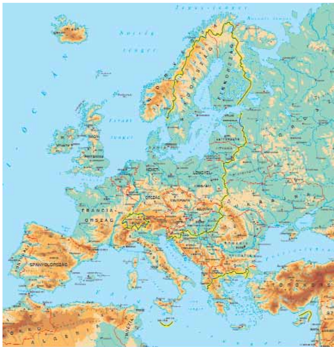
2. ábra. Az Európai Unió partjait a bővítési folyamat lezárása után tizenhét tenger mossa (az Égei-, Jón-, Adriai-, Tirrén-, Ligur-, Földközi-, Északi-, Barents-, Krétai-, Fehér-, Fekete-, Balti-, Jeges-, Ír-, Kelta-, Norvég-tenger és az Atlanti-óceán). – Magyarországhoz ekkora területet még soha nem csatoltak... (Készítette a HM Térképészeti Kht.)

akik az uniós fogalmak szerint a fiatal kategóriába sorolhatóak) a mindennapok szintjén érződik majd az uniós csatlakozás, ezért érdemes tisztában lenniük, hogy miről is van szó és mit jelent az European Youth (európai fiatalság) program! (Bővebbet a http://europa.eu.int/comm/education/youth.html , a Tempus Közalapítvány www.tpf.iif.hu weboldalán, illetve tpf@iif.hu elektronikus levelezési címén.)