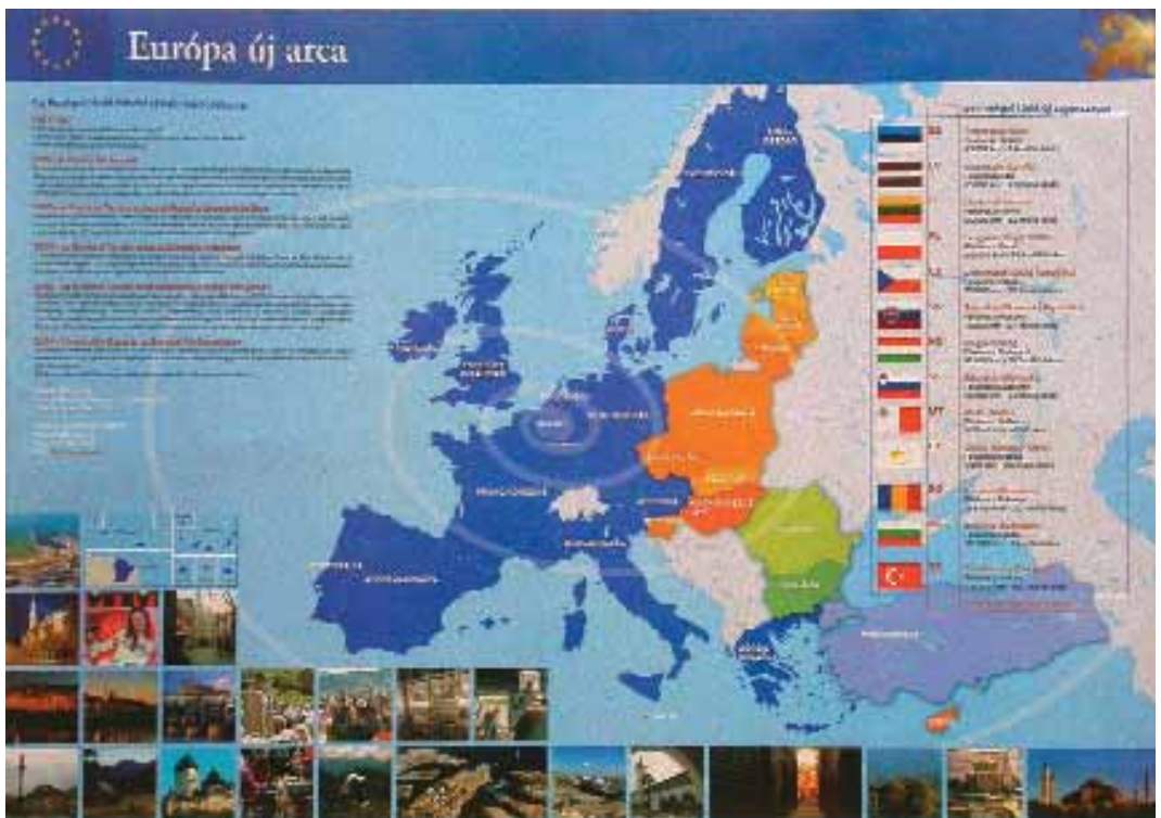
1. ábra. Az Európai Unió vázlatos térképe a bővítési folyamat lezárása után, a Tizenötök, a Tízek és a Hármasok (a várolistas államok) kiemelésével

Az Európai Tájékoztatói Központ www.eu.hu/index.php?mlds=5&request honlapján magyarul és az Európai Unió más, rendszeresen frissített tartalmú honlapjain pedig az érdeklődők naprakész válaszokat találhatnak idegen nyelveken, és további kérdéseket tehetnek fel. Leghamarabb a 15–25 év közöttiek életében (vagyis