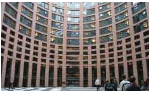
3/d ábra. Az Európai Unió Parlamentjének strasbourgi épülete

Közösség (1993 óta röviden Európai Közösség, EK), az Európai Atomenergia Közösség (EURATOM), és az Európai Szén- és Acélközösség (ESZAK).