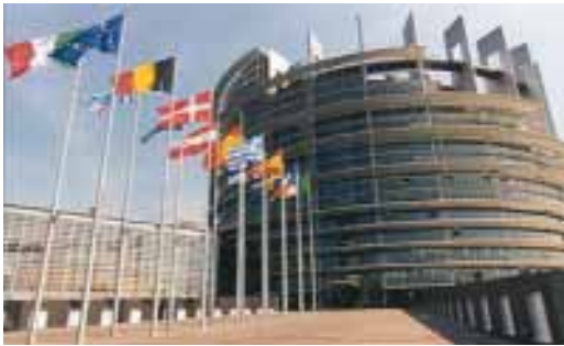
3/a ábra. Az Európai Unió Parlamentjének strasbourgi épülete

állam termeli meg. Magyarország csatlakozásával mindössze 0,7 százalékkal járul hozzá a huszonöt tagállam együttes nemzeti össztermékéhez. Így minden 142,5 euróból csupán egyetlenegy keletkezik hazánkban. A tizenöt tagállamban 5,8-szer annyiba kerül a dolgos kéz, mint nálunk, azaz itt a bérköltség csak tizenhét százaléka a „nyugatinak”. (Bővebbet a www.google.metro.hu/portal_index2.php honlapon.)