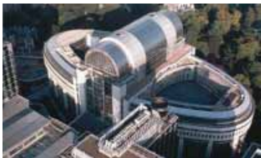
3/c ábra. Az Európai Unió Parlamentjének brüsszeli épülete