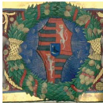
Trapezuncius Cod.Lat. 424. Hunyadi-címer Magyarország és Csehország címerével.