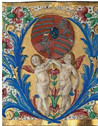
Philostratus Cod.Lat. 417. Hunyadi-címerváltozatok Magyarország és Csehország címereivel.