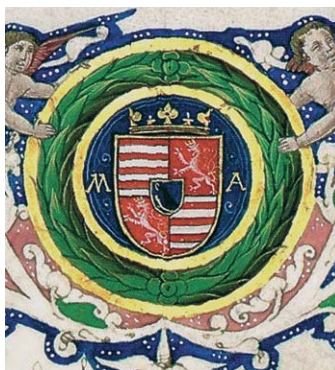
Cyprianus Cod.Lat. 529. Hunyadi-címer Magyarország és Csehország címerével. Az M és A monogram valószínűleg Mátyás és az Aragóniai család nevére utal.