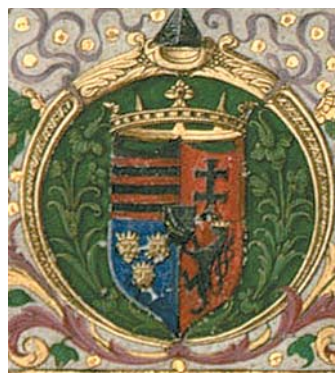
Chrisostomus. Cod.Lat. 346. Hunyadi-címer Magyarország, Dalmácia és Csehország címerével.