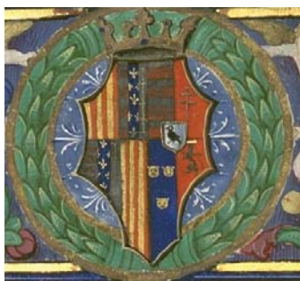
Agathias. Cod.Lat. 413. Aragóniai Beatrix és Mátyás címere Magyarország, Csehország és Dalmácia címerével.