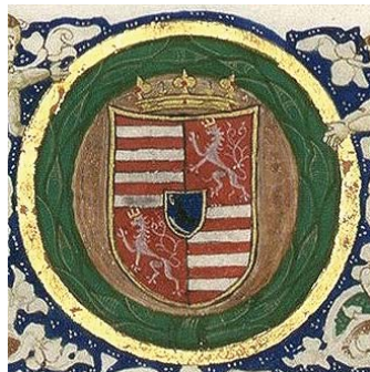
Polybios. Cod.Lat. 234. Hunyadi-címer Magyarország és Csehország címerével.