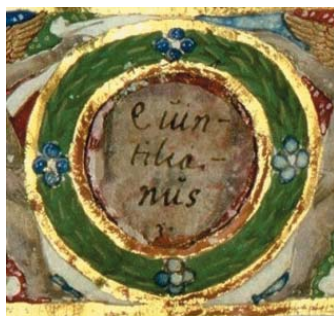
Quintilianus. Cod.Lat. 414. Egy kikapart címerhely.