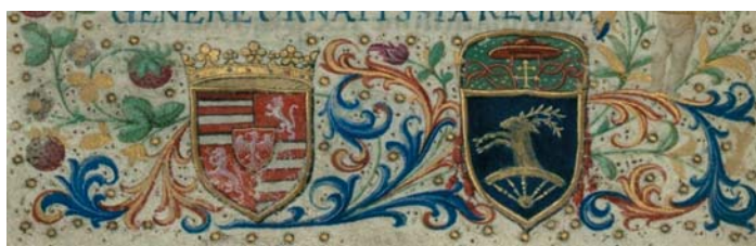
Ransanus. Cod.Lat. 249. Beatrix és Ransanus püspök címere Petrus Ransanus: Epitoma rerum Hungaricarum című művéből.

donosa, Lorenzo Medici már saját címerével látta el. A nagy kódexkészítő műhelyek, mint a firenzei Attavante dei Attavanti, előre gyártottak kéziratokat, melyekben a remélt későbbi megrendelő címere számára helyeket hagytak ki. Így valószínűleg még a Corvina könyvtár részére megrendelt kódexek közül is voltak olyanok, melyek-