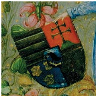
Graduale Cod.Lat. 424. Magyarország címere a kettős kereszttel, Hunyadi-címer a holló- val, Dalmácia címere a három leopárdfejjel.