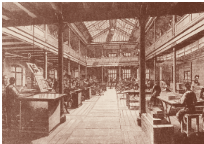
Az Emich Gusztáv Könyvnyomda belseje