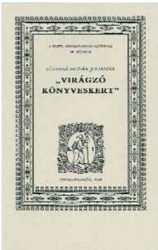
A Kner Nyomdaipari Múzeum 35. füzete

A gazdag illusztrációs anyag segítségével képet kívántunk adni arról, hogy milyen volt a viszony a nyomdatulajdonos és alkalmazottai, a Kner család és a helyi lakosok között, milyen hatással