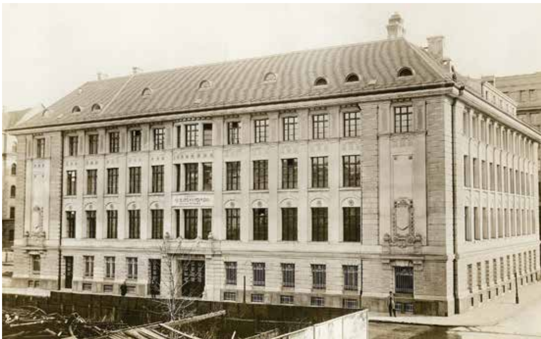
A Pénzjegynyomda épülete