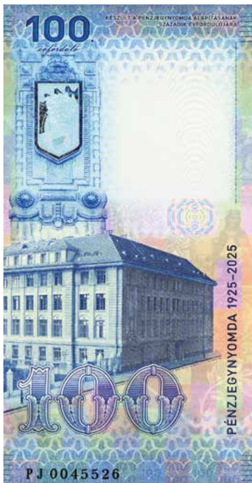
Emlékbankjegy elő- és hátoldala. – Tervezte: Pálinkás György

A Pénzjegynyomda alapítása és működésének megindulása jól mutatja, miként válik egy összetett politikai és gazdasági döntéssor kézzelfogható valósággá. Az első részben bemutatott tárgyalások, szerződések és nemzetközi kényszerek a második rész eseményeiben nyertek gyakorlati értelmet: az épület felépítésében, az akkor igen korszerű gépek üzembe helyezésében, és az első már itthon előállított bankjegyek létrehozásában, kibocsátásában.