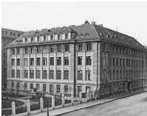
A Pénzjegynyomda épülete az irodaépület helyén állt a rózsakerttel

Az építkezésről egy rövid cikk a Nyírvidék 1923. szeptember 21-i számában: