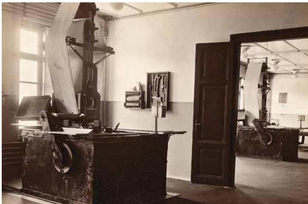
Síkagyas réznyomó gép