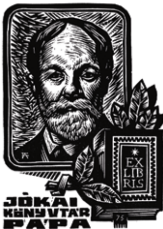
6. kép. Fery Antal fametszete (1975)

Jókai Mór csak egyetlen tanévet töltött Pápán, az 1841–1842-est, az itteni református kollégiumban tette le az érettségét. E helynek óriási szerepe volt írói fejlődésében, itt döntötte el végképp, hogy író lesz. Ehhez az ösztönzést az önképzőkörben elnyert pályadíj adta, amelyet a Tűz és víz című novellájáért kapott. Pápa nem csupán iskolaváros, de élénk polgárváros is volt Jókai idejében a maga 12 ezer lakosával, kaszinójával, vásári nyüzsgésével. Jókai itt ismerte meg Petőfi Sándort, szoros baráti kötelék alakult ki kettejük között, a két évvel idősebb Petőfi öccseként támogatta Jókait. 1846-ban majdan együtt hívták életre a Tízek Társaságát, amelynek tagjai később az 1848-as márciusi ifjakként váltak ismertté. A nagy barátságuknak az vetett véget, hogy Jókai – Petőfi tiltakozása ellenére – feleségül vette a nála nyolc évvel