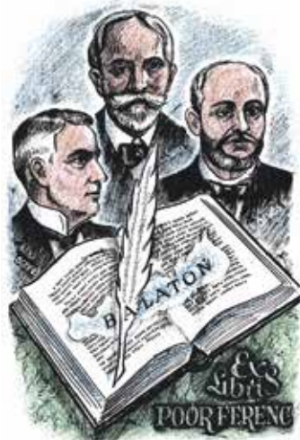
10. kép. Kertes-Kollmann Jenő grafikája

Szoboszlai Mata János fametszete szövegében („Jókai 100 könyve”) is hangsúlyozza Jókai gazdag írói világát – a grafika ábráján a Pegazuson ülő, csillagok közé röptető író szimbolikus alakja látható, aki maga is csillagot tart a feje fölött, alatta sárkány által bekerített város. A mesebeli elemek Jókai határtalan képzeletére utalnak. (9. kép)