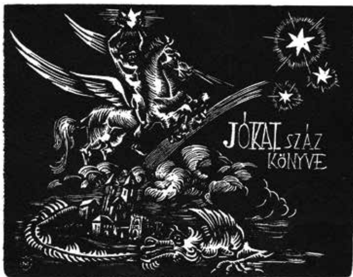
9. kép. Szoboszlai Mata János fametszete (1936)

A Jókai-család 1867-ben telket vásárolt Balatonfüred központjában, ezen villát építtettek, melyet 1870-ben vettek birtokba. A teraszról gyönyörű kilátás nyílt a Balatonra és Tihanyra. Jókai húsz éven át töltötte itt a nyarakat, ezen a helyen írta többek között Az arany ember és A Fekete gyémántok című regényeit, emellett a fővárosi lapok részére számos elbeszélést, regét és fürdőtémájú cikket küldött. A felújított