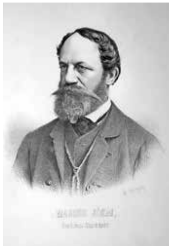
3. kép. Adolf Dauthage alkotása (1870-es évek)

Adolf Dauthage (1825–1883) osztrák litográfus portrékat készített a politikai és egyházi élet, illetve a művészvilág tagjairól. Jókait – ahogyan az ábra felirata („Reichstag-Abgeordneter”) is utal rá – mint országgyűlési képviselőt jelenítette meg. A kép az 1870-es években készült, az Osztrák–Magyar Monarchia politikai személyiségeit bemutató parlamenti portrészorozat részét képezi ( Das Parlament. Die politischen Persönlichkeiten Oesterreich-Ungarns in Wort und Bild , Wien, 1879). (3. kép)