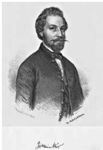
2. kép. Barabás Miklós litográfiája (1854)

Petőfi Sándort és Jókai Mórt. Litográfiáit leggyakrabban Walzel Ágost Frigyes sokszorosította, aki éppen a jeles művész-szel való együttműködésének köszönhetően az 1840–50-es években a korabeli Magyarországon egyik legsikeresebb litográfiai műhelyét üzemeltette Pesten. Barabás egyik könyvmata 1854-ből a fiatal, 29 éves Jókait ábrázolja, a képen alul az alkotó aláírása és a Walzel-nyomda neve is olvasható. (2. kép)