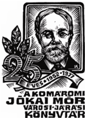
5. kép. Fery Antal fametszete (1977)

Fery Antal alkotott emléklapot „25 éves a komáromi Jókai Mór Városi-Járási Könyvtár 1952–1977” felirattal, a névadó portréjával. (5. kép)