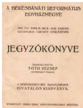
Református egyházmegyei kiadvány

Szerzői kiadásban jelent meg nyolcféle kiadvány: öt alkalmi mű (közülük négy „rémirodalom”), kétféle irodalmi és egy egészségügyi könyv 6. kiadása.