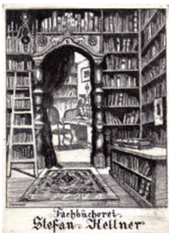
12. ábra. Conrad Gyula rézkarca (Lelőhely: OSZK, jelzet: Exl.K/201)

mély (négy férfi és egy nő) ül az asztalnál, mindannyian a könyvük fölé hajolva olvasnak. A grafika rendezőelve a fény-árnyék hatás, az alakok az előtérben a lámpa fényében megvilágítva kapnak hangsúlyos megjelenítést, és mögöttük, a sötét háttérben rajzolódanak ki a könyvespolcok körvonalai, rajtuk – a használatot tükrözve – némileg rendezetlenül sorakoznak a könyvek. (13. ábra)