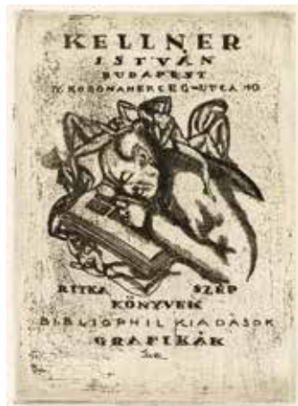
8. ábra. Gara Arnold rézkarca (Lelőhely: OSZK, jelzet: Exl.K/186)

a gyűjtők egy rétege számára különösen nagy értékkel bírtak, és magas áron keltek el. Gyűjteményének erotikus vonalát hangsúlyozandó szerepelnek az előbb említett alkotáson a nagytítóval könyv fölé hajló férfi körül női aktok. (8. ábra)