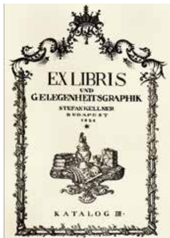
16. ábra. Stefan Kellner: Ex libris und Gelegenheitsgraphik (Budapest, 1921)

Kellner István egyik legfőbb, máig ható érdeme, hogy fontos feladatának tartotta a művészi ex librisek és könyvek készítésének, forgalmazásának és gyűjtésének előmozdítását hazai és nemzetközi szinten, amiért rengeteget munkálkodott. Az imént bemutatott, Kellner könyvkereskedését és gyűjteményét hirdető, igényes kiállítású kisgrafikák a reklám mellett a művészi cél szolgálataiban is álltak, e művek az utókor számára fontos kultúrtörténeti értéket képviselnek, betekintést nyújtva egy, a 20. század első felében tevékenykedő bibliofil ember, egy elhivatott könyvkereskedő életébe. (16. ábra)