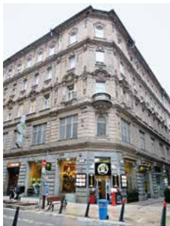
1. ábra. Budapest, Koronaherceg (ma Petőfi Sándor) utca 10. (Fotó: Vasné dr. Tóth Kornélia, 2024)

A német ex libris egyesület cserejegyzéke szerint már 1912-ben rendelkezett több Bayros ex libriszel és saját maga által készített klisé lapokkal is, emellett osztrák művészekről rézkarcokat is cserélt, és az ex librisek mellett plakátokat, visitkártyákat (Besuchskarten) is gyűjtött és kínált cserére. Kellner könyvesboltját, nagy könyvgyűjte-