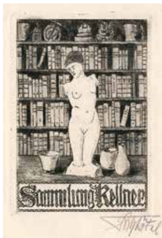
14. ábra. Fritz Bötelt rézkarca (Lelőhely: Exlibrismúzeum, left. sz.: 60349)

a polcokon felül és az asztalon tárgyak, vázák és a középpontban női aktot megformáló nagy méretű torzószobor kap megjelenítést. E tárgyak, régiségek mutatják, hogy Kellner könyvkereskedésébe a könyveken kívül grafikai albumokat, mappákat és sok egyéb, a művészethez kapcsolódó dolgot, műkincset is beszerzett – a vevők igényeihez igazodva. (14. ábra)