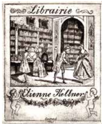
11. ábra. Conrad Gyula rézkarca (Lelőhely: OSZK, jelzet: Exl.K/183)

a nézelődés, a vásárlás folyamatát – az egyik hölgy kezében például egy lornyont is megőrkített, amivel szemléli az elé tett anyagot, a másiknál legyezőt látunk. (11. ábra)