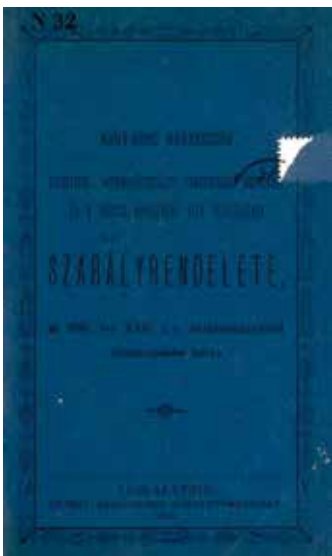
Tisza-menti település közigazgatási kiadványa a Jászságból – a Verseghy Könyvtár gyűjteményéből