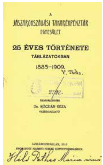
Árokszállási kiadvány a szolnoki városi könyvtár névadója, Hild Viktor könyveiből – a Verseghy Könyvtár gyűjteményéből