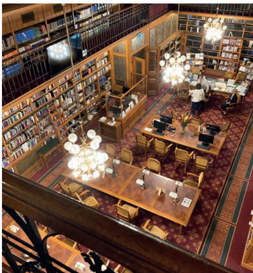
Az Országgyűlési Könyvtár Nagy olvasóterme