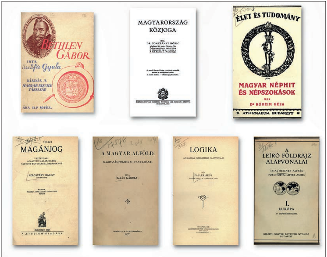
4. kép. A tudományterületek széles körét lefedő művek az 1920-as, 30-as évekből (montázs, borítók).

A törvénynek köszönhetően a hazai szakirodalom tekintetében a kötelezpéldány lett a Ház könyvtárának legfontosabb gyarapodási forrása, amely jelentős mértékben hozzájárult ahhoz is, hogy a könyvtár állománya 1919 és 1939 között megkétszereződött és 1939-ben már meghaladta a 180 ezer kötetet. A kötelezpéldányként érkező kötetek száma 1922 és 1939 között több mint 40 ezer volt, ami az összes gyarapodásnak közel felét jelentette. A törvény a gyűjtőkör kiszélesítése mellett hozzásegítette a könyvtárat ahhoz, hogy