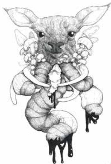
Balczár Lajos: Metamorfózis, tollrajz 2021

diák kezdte meg a 2021/2022-es tanévet. Tizenhárom féle képzést kínálunk: iskolai rendszerű képzéseink mindegyike érettségire épül, vagyis emelt technikai és szakgimnáziumi képzéseket nyújtunk diák-