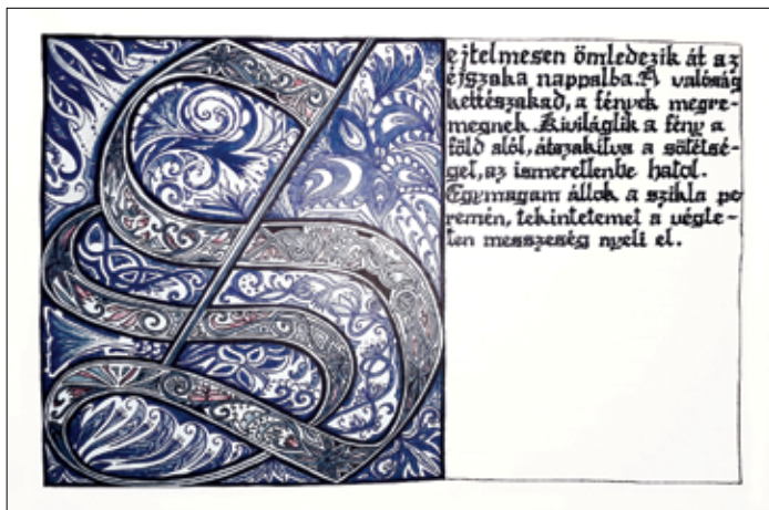
Jurás Panni iniciáléja