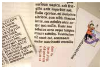
Kiss Renáta munkái

A SZÁMALK-Szalézi Technikum és Szakgimnáziumban 2021 szeptemberében 605 fő nappali és 254 fő esti tagozatos