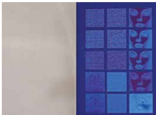
1. ábra. A létrehozott UV-nyomat; a bal oldalon megvilágítás nélkül, a jobb oldalon megvilágítva

A grafikai tervezés során azt a problémát kellett megoldani, hogy a két UV fluoreszcens festékkel elkészülő nyomtatáshoz kompatibilis legyen a grafika. Meg kellett oldani például a forrásként talált RGB színmódú, 3D szteganográf képek átalakítását CMYK színmódra, illetve redukálni kellett a színek számát kettőre, cianra és magentára. Ezeket és a további felmerülő problémákat szoftveresen küszöböltük ki.