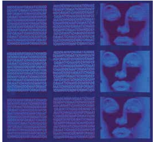
3. ábra. Az ötvözött szteganográf és anaglif nyomatok

A kísérlet másodlagos célja az anaglif képkalkotás és a szteganográfia ötvözésének kidolgozása volt. A szteganográf grafikáknál azt tapasztaltuk, hogy az elrejtetni kívánt üzenetek, képek szabad szemmel is könnyen kivehetők, olvashatóak voltak (3. ábra), nem fedték el őket eléggé a zavaró mintázatok, anaglif szemüveggel tekintve viszont még jobban látszódtak.