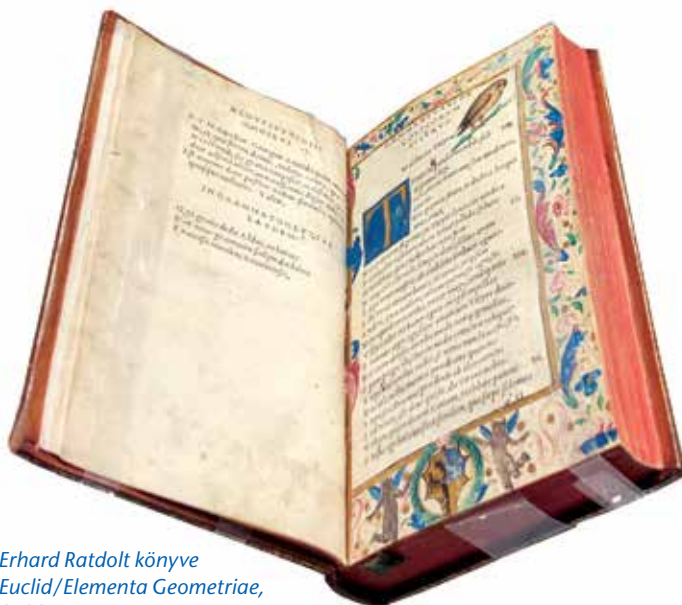
Erhard Ratdolt könyve Euclid/Elementa Geometriae, 1482