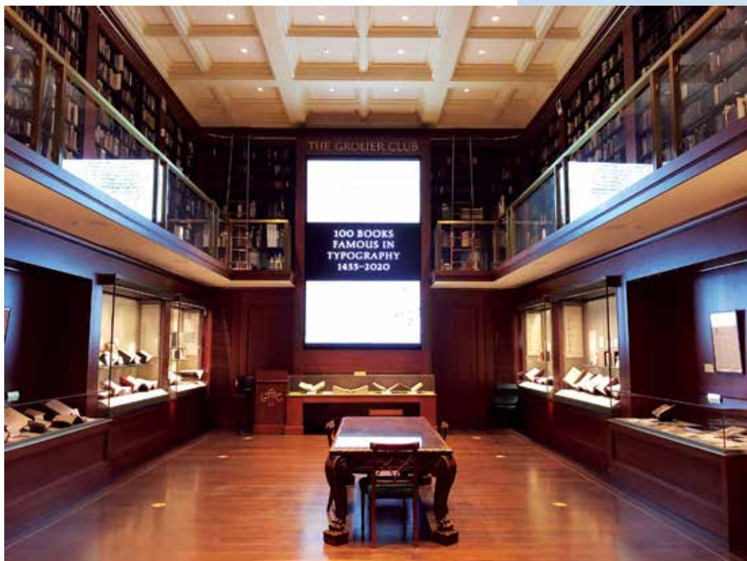
Tipográfiai kiállítás a nagyteremben