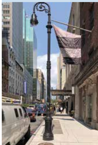
A Grolier Club bejárata, New York

Az első „Grolier 100” kiállítást számos hasonló követte, változatos témákban. Bemutatták a korai amerikai irodalom, az orvostudomány, a gyermekirodalom és még sok más tematika száz legfontosabbnak tartott könyvét. A Grolier-listák amolyan, komoly presztízszt adó referencialistává váltak. Ez év májusában egy, a társaság szívéhez és hitvallásához nagyon közeli tematika, a tipográfia került elő. A kiállítás rendezői a közel hat évszázad tipográfia történetének mérföldköveit mutatták be. A száz könyvvel tükrözték a technika változásait Gutenbergtől a digitális nyomtatásig, felvillantották a legkiválóbb mestereket, például Garamond, Baskerville, Bodoni