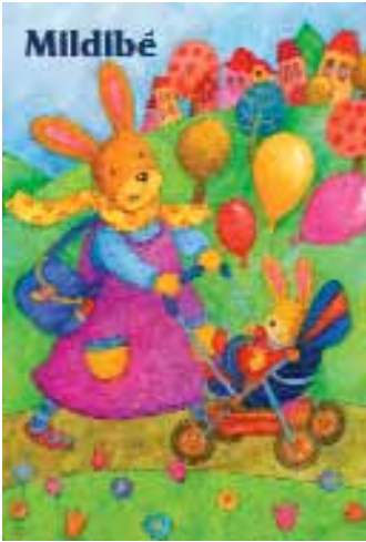
A Mildibé csecsemőtápszer plakát és csomagolása, Téli meséhez

készülnek ugyan, utólag azonban különféle olajfestményt idéző effektekkel, digitális úton tette érdekesebbé a felületeket. Mindez az eredeti természetesen nem látható, kizárólag nyomtatásban, az immár kész könyv illusztrációin élvezhető. Szép példa erre Miklya Zsolt Történetek a Pirosoviból című mesekönyve. Korábban azt mondtam, ebben a világban minden olyan bájos. Igen, bájos, de még a „túl szép” határán innen. Mert bizony sokan, akik gyerekeknek rajzolnak, beleesnek abba a hibába, hogy elkezdnek gügyögni, és igen, igen, mondjuk csak ki: édes, giccses szirupot festeni! Nagyon keskeny ez a határmezsgye, és a vékony pengeélen merészkedve bizony könnyedén át lehet billenni a másik oldalra. Kállai Nagy Krisztinának azonban sikerül megmaradni az inenső oldalon, ahol a szép még pusztán szép. Vajon hogyan tudja távol tartani magát a Rettentő Rózsaszínű Rémtől?