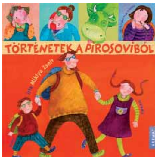
Történetek a pirosóviból, illusztrációk

Figuráit áthatja egyfajta meleg, gömbölyű, hajlékony kedvesség, képein egy töről fakad a melák medve és a bájosan bumfordi királykisasszony. Szemmel láthatóan rokonok itt az egyébként mégoly nehezen egymáshoz rendelhető dolgok,