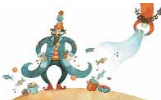
Ezüstsztín fonál verseskönyv illusztrációk

A „kisképzőből” aztán majdnem egyenes út vezetett az Iparművészeti Főiskolára, előtte azonban a Pannónia Filmstúdióban dolgozott két évig, ahol egy animátorképző tanfolyamon is részt vett.