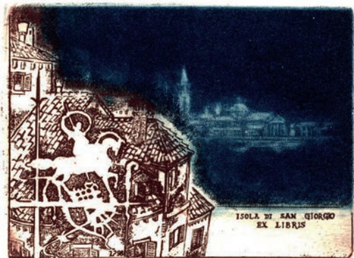
7. kép. Isola di San Giorgio ex libris (1998), 62 × 83 mm

Felidéződik például a 15–16. századi Aldus Manutius velencei humanista, nyomdász és kiadó, az Aldine Nyomda megalapítója portréja és nyomdászjelvénye. A 16. században működő Gerardus Mercator flamand térképész, a modern térképészet mestere arcképét a földgolyót tartó titán, Atlasz alakja egészíti ki. Ürmös Péter több ex librisén a rézkarc technikát aquatinta eljárással egészítette ki, ezzel érve el különböző tónusú, árnyalt, foltszerű hatást. A kisgrafikák közül kitűnnek azok, melyek változatos színkezeléssel készültek, e téren kiemelném az olasz Szent György-pályázatra 1998-ban alkotott ex libris mélykék–barna színparosítását. A mű borzolásos technikával készült, a Velencéhez tartozó Szent György-szigetet (Isola di San Giorgio) ábrázolja. (7. kép)