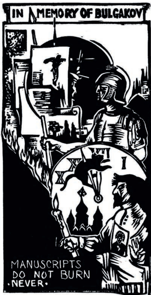
4. kép. In memory of Bulgakov (1991), 120 × 60 mm

egyik kulcsmondata olvasható: „Manuscripts do not burn never” [„A kéziratok nem égnek el”]. (3–4. kép)