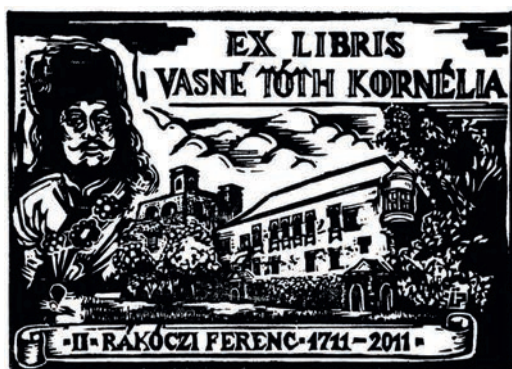
5. kép. Ex libris Vasné Tóth Kornélia (2011), 82 × 113 mm

Több in memoriam grafika állít emléket „a legnagyobb magyar”-nak, az idén 230 éve született Széchenyi Istvánnak (1791–1860), aki nemcsak politikusként érdemelte ki ezt a címet, tevékeny részt vállalt Magyarország gazdasági életének felvirágoztatásában. Többek között nevéhez fűződik a dunai gőzhajózás fejlesztése, támogatta a