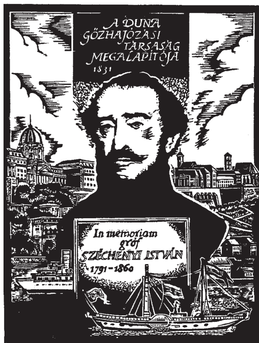
6. kép. In memoriam gróf Széchenyi István 1791–1860 (1992), 195 × 148 mm