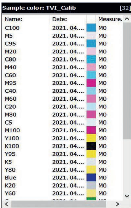
5. ábra. Az elkészült Color Library

A mérőcsíkot, a hozzá tartozó táblázatokat, a Color Library-ket többféle papírtípushoz elkészítettem, és a Facebook Color csoportjában megosztom a lapszám megjelenését követően, bárki használhatja, ha a mérési időt le akarja rövidíteni.