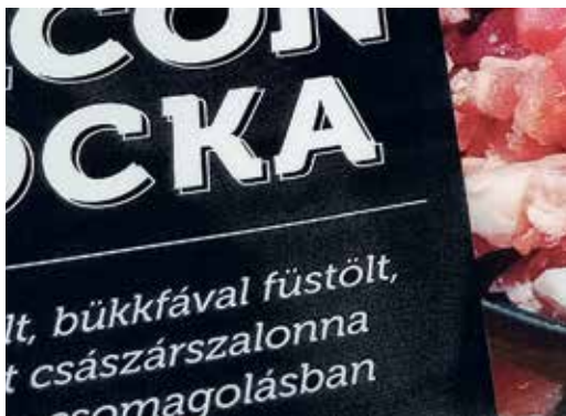
A fekete alapon végigfutó, finom árnyalatú füstmotívum előkészítése is fokozott gondosságot igényelt

Többéves kísérletezés előzte meg a Gierlinger kockázott császárszalonna termék adaptációját, ám az általunk korábban alkalmazott oldószeres flexótechnológiával nem sikerült a vevői igényeknek megfelelően megközelíteni a mélynyomtatás minőségi kritériumait. A Pandan Kft.-hez 2019-ben telepített 9 nyomóműves BOBST M6 UV-flexó nyomdagép a rendelkezésünkre álló fejlesztési lehetőségeket nagymértékben bővítette.