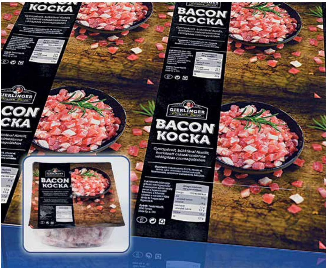
A Gierlinger kockázott császárszalonna UV-flexós fólianyomata és termékcsomagolása

A környezetterhelés szempontjából elmondható, hogy a nyomóforma-készítést figyelembe véve egy környezetbarátabb technológiát választottunk a mélynyomóhenger gyártása, vésése helyett a flexográfiai fotopolimer nyomóforma