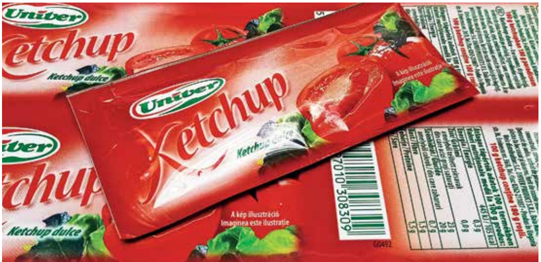
Az Univer Ketchup 15 ml-es termék UV-flexóval nyomtatott fóliája és csomagolása. Az eredetileg direktzöld szín a kitűnő passzerpontosságnak köszönhetően mind a vonalkódnál, mind az egyéb szövegeknél többszínű heptakróm bontással lett nyomtatva

Amikor használatba vettük a rendszert, sok mindennek összehangolása kellett működni. Mivel korábban az oldószeres flexótechnikát alkalmaztuk, az ott szerzett tapasztalatokat felhasználva, az elért eredmények tükrében az új technológiát is a fogyasztói igényekhez kellett igazítanunk, bízva abban, hogy az elvárásoknak