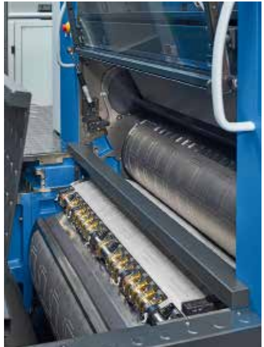
A forgó stanc egységei a kiforrott Rapida rendszeren alapulnak

A felhasználók azt tapasztalták, hogy a Rapida RDC 106 teljesítménye körülbelül 25%-kal magasabb, mint a síkágys társaiké. Ebben nagy szerepe van a 12–13 000 ív/óra átlagos sebességnek. Az RDC beállításban is sokkal gyorsabb. Az ismételt munkák a vágás, biegalás és dombornyomás