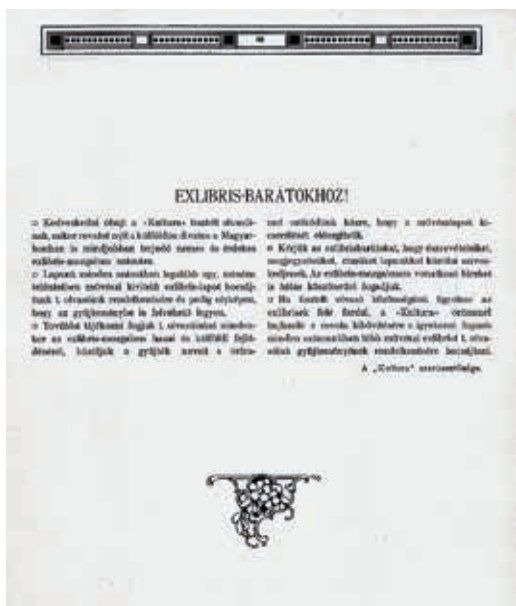
5. ábra. Felhívás ex libris gyűjtőkhoz (Kultura, 1911/1.)