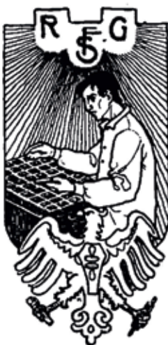
2. ábra. Rötttig Gusztáv és Fia Nyomda (nyomdász-jelvény)