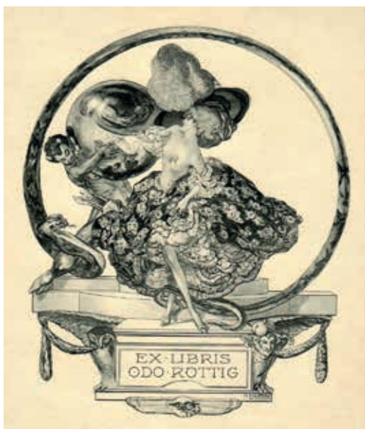
6. ábra. Röttig Odo ex librise (grafikus: Franz von Bayros)

Holl Jenő stb. és persze maga Röttig Odo. 9 Külföldiek (osztrákok és németek) is csatlakoztak. A Röttig Gusztáv és Fia cég a csereforgalomhoz szükséges nyomtatványokat is forgalmazott, minden kívánt nyelven. Emellett vállalta rajzok után ex libris lapok elkészítését, és elsődrendű művészek rajzának megszerzését.