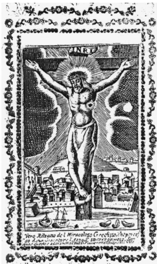
3–4. ábra. A német nyelvű változat és az utánmetszett olasz nyelvű változat

dését. Az évente megjelentetett könyvek száma két-háromnál nemigen volt több. Lavrenz Karletzky 1798-ban bekövetkezett haláláig az általa kiadott nyomtatványok száma nem érte el a harmincat. Tipográfiájában a kiadványok nyelvi szempontból főleg latin, majd olasz, német és a század végén már horvát nyelven jelentek meg.