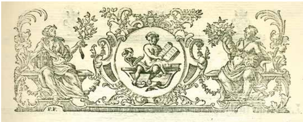
5. ábra. A fiumei nyomda egyik fejléce

nyelvű változatnak (3. ábra) az utánmetszése, amely önálló imalapon szerepelt, és így maradt fenn. A magyarországi szakirodalom eddig összesen három, két német és egy olasz nyelvű felirattal készült fiumei Csodakeresztet ábrázoló rézmetszetet tart számon. Közöttük azonban nem szerepel a fiumei tipográfiai anyag összeállítása során most megismert, a Karletzky nyomda által 1796-ban megjelentetett horvát nyelvű kiadványában szereplő, olasz nyelvű felirattal ellátott és nyomdai cifrákkal körülvett Csodakereszt változata.