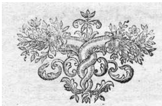
1. ábra. E könyvdísz az olmützi tipográfiában 1762–1764 között volt használatban, míg a fiumei nyomda első alkalommal 1783-ban szerepeltette

A Hungaria Typographica 18. századi sorozata keretében az 1779-ben alapított fiumei Karletzky nyomda 1800-ig használt készletének feldolgoása is elkészült. 1 E nyomdai készlet feltárása kapcsán szerzett ismereteinket kívánjuk az alábbiakban közétetni.