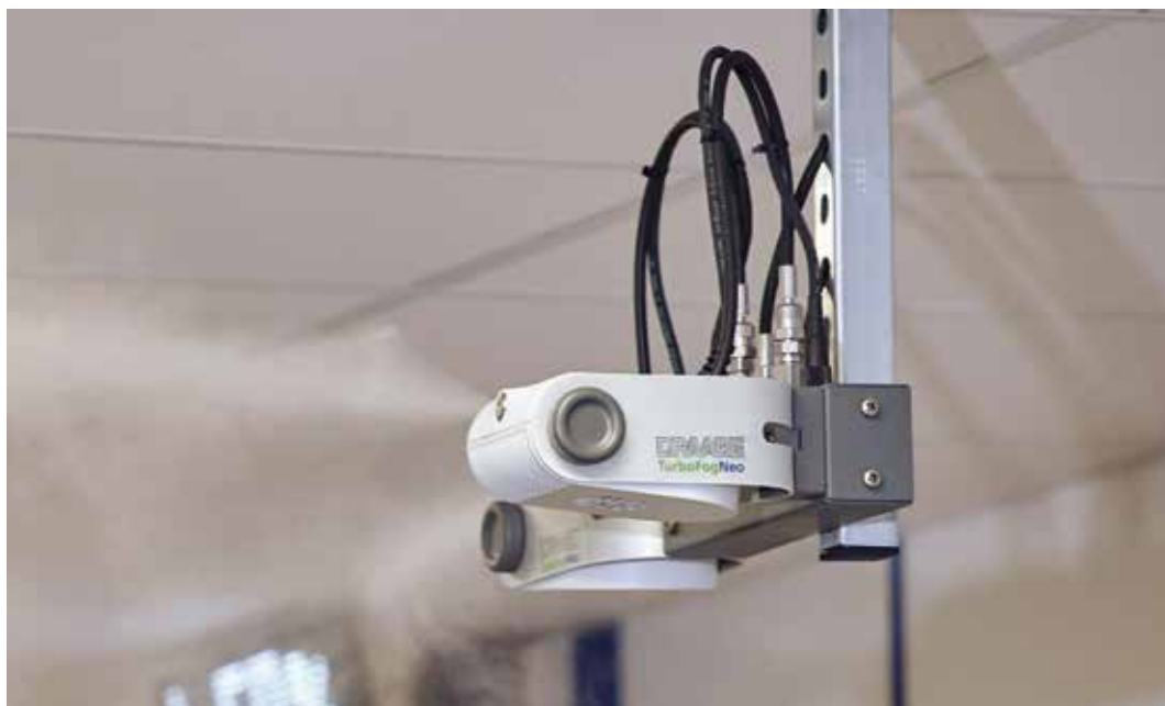
Draabe TurboFogNeo direkt helyiség párasítás

tással van a levegő páratartalmára is: emelkedő hőmérséklet esetén csökken a relatív páratartalom, annak minden negatív kihatásával az anyagra és a folyamatra.