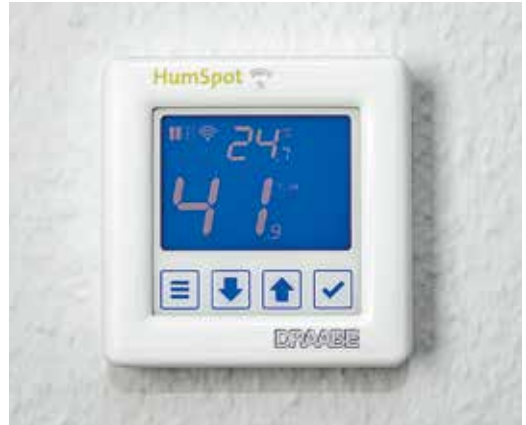
Digitális vezérlés: hajszálpontosan