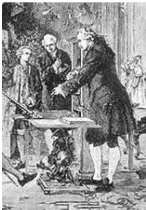
Trattner és II. József (korabeli rézmetszet, részlet)

A bécsi Johann Thomas Trattner pályája gyorsan ívelt fölfelé: a szerény körülmények közé született vállalkozó kedvű nyomdász Mária Terézia és utódai pártfogását is elnyerte. Pályája valódi sikertörténet. Jól ismert az a kép, amelyen az udvari öltözékű Trattner kis házi sajtón tanítja a könyvnyomtatás művészetére az ifjú trónörökös, a későbbi II. Józsefet.