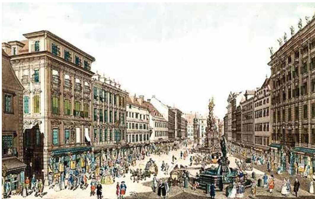
A bécsi Graben korabeli színezett metszeten: a bal oldali négyemeletes ház a Trattner-Hof 2

valamilyen vállalkozást. Először Pozsonyban 1781-ben, majd 1783-ban Pesten és 1784-ben Temesváron. Könyvlerakatai azonban Pozsony, Pest és Temesvár mellett négy további magyarországi városban is voltak.