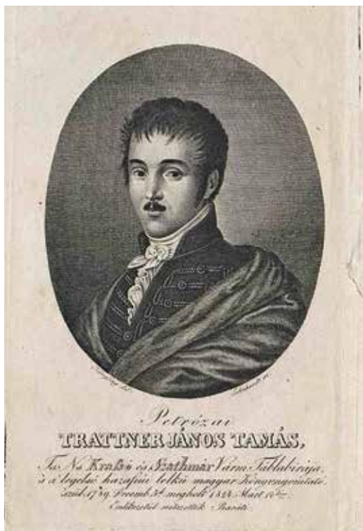
Trattner János Tamás (1789–1824) 8

alusznak...” Az alkalmazottak számát tekintve csak a budai Egyetemi nyomda foglalkoztatott több személyt.