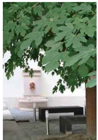
A Trattner-Károlyi ház ma (Petőfi Sándor utca. Átjáró a két udvar között és a ház udvara