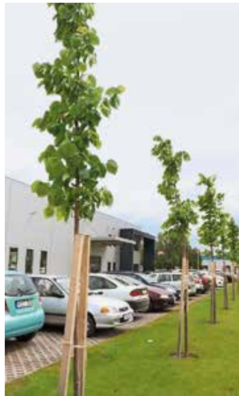
Zölden, nemcsak a termelésben