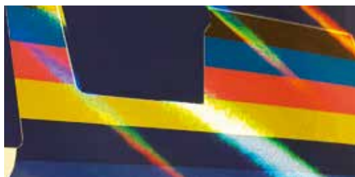
Holografikus hatású felület

A Cast and Cure technológiával UV-lakkozott termékek tehát a vizsgálatok tapasztalataira hivatkozva és saját technológiai ismereteinket figyelembe véve a megrendelői igényeknek