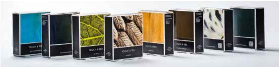
Schmid Rhyner Touch & Feel termékek