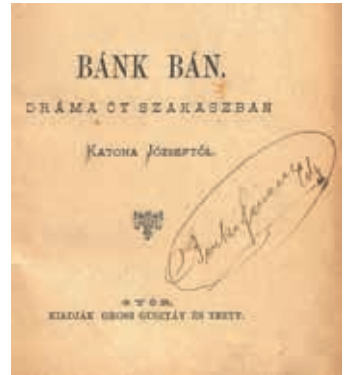
Katona József: Bánk bán . Győr, Gross Gusztáv és Testv.

Az említett tendenciák mind-egyike megfigyelhető Győr esetében is. A rohamosan fejlődő, kereskedővárosból a szá-