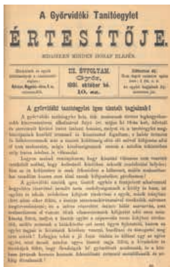
A Győrvidéki Tanítóegylet Értesítője, 1881