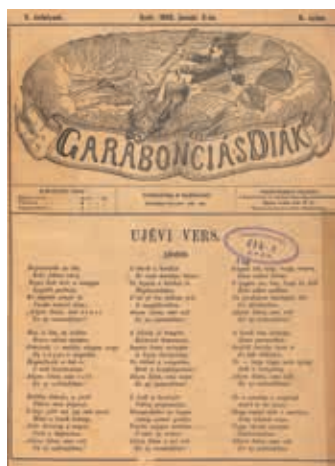
Garabonciás Diák 1886. Újévi szám

adatok szerint 1890 táján Gaar Iván Haar Vilmos sal társult a vállalkozást fellendítendő; együttműködésük azonban csak rövid ideig tartott, mert Gaar kilépett az üzletből. Haar Vilmos ekkor Szávay Gyulával társult, majd Raab Béla is lépett a vállalkozásba – hogy azután Haar távozásával Raab és Szávay vigye tovább a műhelyt. Az a tény, hogy a több lapot is szerkesztő és kiadó Szávay Gyula érdekelt volt a vállalkozásban, magyarázza, hogy másfél évig itt jelent meg az általa szerkesztett Győri Hírlap is – és hogy a Pannonia-nyomdából került ki 1896-ban Szávay Gyula Győr-monográfiája is. Mivel Szávay „mellesleg” a Győri Kereskedelmi és Iparkamara tisztségviselője is volt, érthető a kamarai kiadványok jelentős aránya is. De figyelemre méltó az is, hogy Pereszlényi János református lelkész két időszaki kiadványa is e nyomdából került ki: a Hazánk négy (1883–1887), a Dunántúli Protestáns Közöny hat évig (1885–1890) készült a Pannonia-nyomdában.