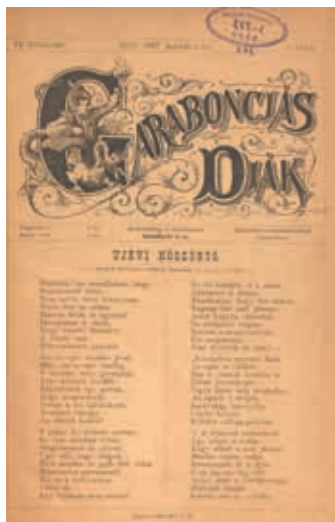
Garabonciás Diák 1887. Újévi szám

A műhely fellendülése az 1890-es évek közepétől kezdődik meg, Raab Béla irányítása alatt; ennek eredményei azonban a 20. század elején fognak majd beérni – így arról a következő részben szólok részletesebben.