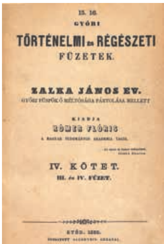
Győri Történelmi és Régészeti Füzetek IV. köt. III. és IV. füzet. Győr, Sauervein ny., 1869

zad végére már ipari várossá váló Győr lakossága jelentős mértékben növekszik. A már nagy múlttal rendelkező iskolái – jogakadémia, papnevelő intézet, bencés főgimnázium, főreáliskola – mellett újabbak kezdik meg működésüket, egyre több munkát adva – például az iskolai értesítők megjelenítésével – a város nyomdáinak. Az említett intézmények tudós tanárainak tudományos munkái mellett a helyi egyesületek – mintegy félszáz működött belőlük a 19. század második felében – is rendszeres megrendelőkké válnak, a könyvek mellett időszaki kiadványokkal is jelentkezve. Az újságok fejlődésében nem ritkán színtet „leltárszerű” felsorolásukkal találkozhatunk; amint azt például a Győri Közlöny 1879-ben megjelent számainak alcímében olvashatjuk: „A győrvidéki gazdasági egyesület, a