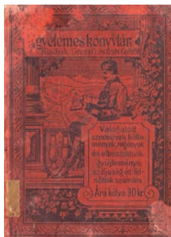
Gross Gusztáv „Egyetemes Könyvtár” sorozatának borítója

A műhely fő profilját azonban a könyvkiadás jelentette: a vizsgált időszakban itt jelent meg a legtöbb mű, és előállításuk színvonala is kiemelkedő. A „Gross Gusztáv”, „Gross Gusztáv és Társa”, illetve „Gross Testvérek” impresszummal megjelenő kiadványok méltán érdemelték ki a kortársak, valamint az utókor elismerését. Két nagy sorozatot indított: a Gross magyar ifjúsági könyvtára 1880 és 1884 között jelent meg; majd 1885-től indult útjára az Egyetemes Könyvtár , Ferenczy