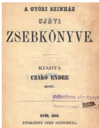
Czakó Endre: A győri színház újévi zsebkönyve . Győr, Czéh Sándor ny., 1869

evangélikus és református ima- és énekeskönyveket nyomtattott, de készültek itt római katolikus kiadványok is.