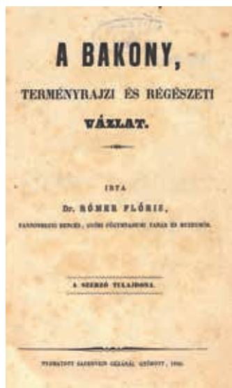
Rómer Flóris: A Bakony . Győr, Sauervein ny., 1860.

Győr város harmadik nyomdáját ifjabb Czéh Sándor alapította 1869-ben. Annak az 1813-ban Győrött született Czéh Sándornak a fia, aki 1825 és 1830 között a győri Streibignyomdában sajátította el a mesterség alapjait, majd 1836-ban Magyaróvárról nyitott nyomdát. Fiai közül Lajos vitte tovább a magyaróvári műhelyt; míg Sándor Győrben próbált szerencsét. Egy bő évtized adatott neki mindössze erre, 1880 tavaszán bekövetkezett haláláig. Özvegye három