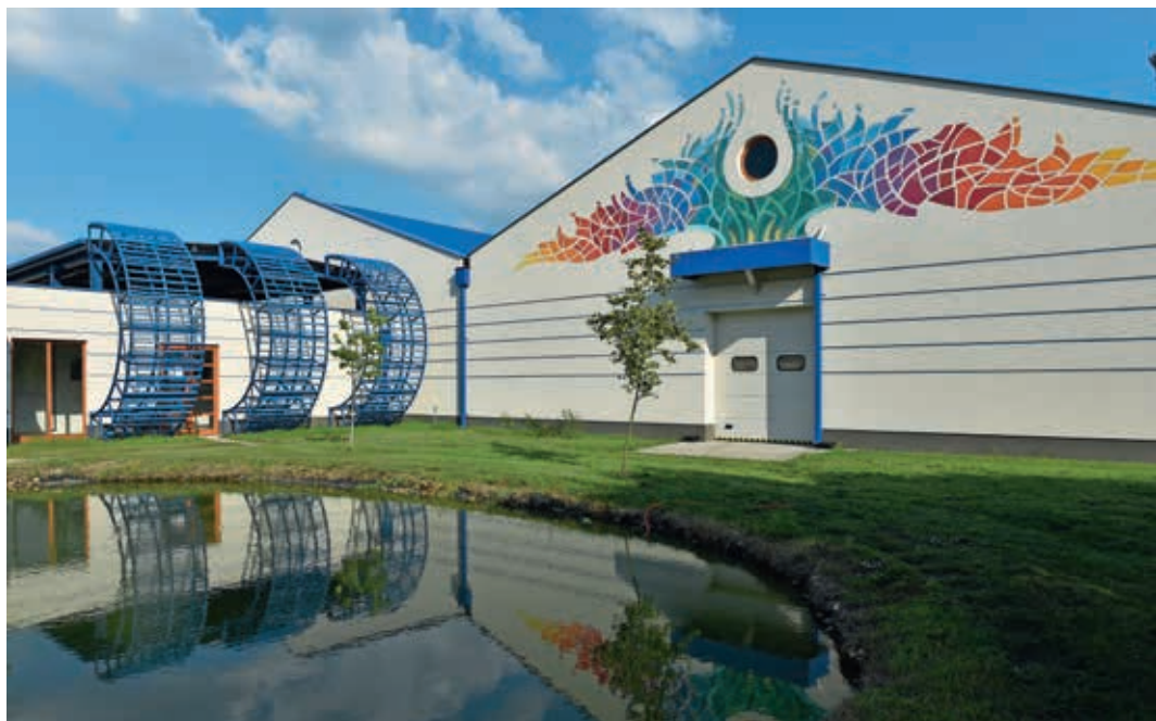
Az új csarnoképület, előtérben a nyomda parkját ékesítő tavacskával

két flexó nyomóművel, plusz prégező és ívrevágó opcióval bővített berendezéssel, ami 450 mm pályaszélességű, 40 és 300 mikrométer közötti vastagságú médiára +/- 0,1 mm automatikus regisztertoleranciával dolgozik.