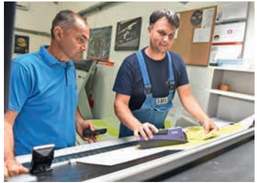
Precíz munka a gépteremben is

teret ambíciói megvalósítására. A termelés minden mozzanatát követve ismerkedett a szakma fortélyáival, mérnöki diplomája elméleti tudással is megtámogatja a gyakorlatban szerzett tapasztalatokat. Nagy lehetőséget lát a csomagolóanyag-gyártásban, amelyhez az utóbbi években sok bővítést hajtott végre a társaság. A B1-es stancoló, dobozragasztó berendezések mellett különösen fontosnak tartották a B1 ötnyomóműves Heidelberg nyomógép lakkozóművet UV-lakkozó opcióval bővíteni, amit az exportmunkák megrendelői gyakran igényelnek. Jó kapcsolatban állnak az alvállalkozó és beszállító partnerekkel, de van egy pont, amikor a megrendelői igények száma a házon belüli fejlesztést elengedhetlenné teszi. Ez a Print 2000 Nyomda számára most érkezett el, biztonságosabb, kényelmesebb, és nagyobb rugalmasságot biztosít számukra a házon belüli UV-felületnemesítés. Az UV-lakkozó berendezés beüzemelését az IST és Heidelberg szakembereivel karöltve végezték. Jó kapcsolat alakult ki a projekt résztvevői között, mindannyian nagy odaadással végezték felada-