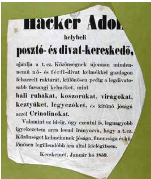
Kereskedelmi reklám, 1859. A nyomtatvány szabásminta darabjaként maradt meg

sal küldte csomagjait, és írta leveleit távol levő fiainak, rokonainak és anyósának, akivel felesége korai halála után is tartotta a kapcsolatot. 2