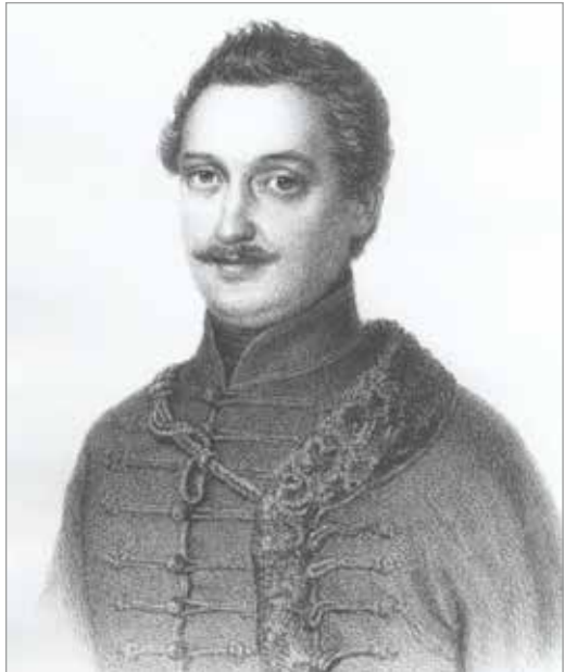
Katona József. Barabás Miklós litográfiája, 1856

A terjedelmesebb magánlevelek egyik központi témája a család és a rokonság. Az idősödő nyomdatulajdonos szeretettel és gondoskodás-