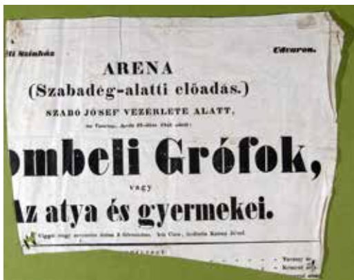
Színlap részlete, 1843. Katona József Múzeum. A nyomtatvány szabásminta darabjaként maradt meg

különben is már elszoktam.” 9 Az utazásra végül májusban került sor, és a szolnoki új indóháznál beszélték meg a találkozót. „...a kocsin pokróczot tétesz lábunk alá, mert ha esső lesz, fölül ugyan nem fogok aggódni a' megázástól, mert veszek esernyőt, de csizmám alkalmasint paczallá válna Kisérig.” 10 Néhány hét múlva ismét egy debreceni útvjáról tudósította ismerőseit, a nyári bécsi kirándulása azonban lábfájás miatt elmaradt, hiszen „ott is kell járkálni az embernek saját talpán, oly helyeken, hová a' különben olcsó fiakereken nem lehet menni.” 11 A Bécsbe induló Szilády Lászlónak jó útikönyvek vásárlását javasolta. 1859-ben is ott volt a pesti Józsefnapi vásáron, útját összekötvé főtí és szadai rokonainak meglátogatásával, majd április végén Debreczenbe ment, hogy „az első májust az új nyomdász urakkal lehessen szerencsém eltölteni”. 12 1860-ban augusztusban is Pestre utazott „a Szent István napi nagyszerű ünnepély megbámulására, melyre, mint hallom, töméntelen nép fog egész hazánkból összeseregleni”. 13 Pestre – más alkalommal – unokáit is magával vitte világot látni, sőt 1865-ben, József fia halála után özvegyen maradt menyét – aki még sosem járt Pesten –, házvezetónőjét és annak kisfiát is megutaztatta, s öt napon keresztül ismertette őket a város nevezetességeivel. (Emiatt elhalasztotta a debreceni új színház meglátogatását.)