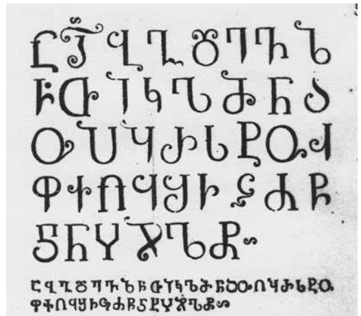
Tótfalusi Kis Miklós grúz mintalapjának részlete (1686 körül)

gén maga fogott bele a magyar nyelvű Biblia ki-nyomtatásába. A Biblia 1686-ra elkészült (ez a Károli-Biblia 1645. évi amszterdami kiadásának javított változata volt), 3500 példányban, majd a következő években külön „kisdéd” formában a Zsoltárokat és külön az Újszövetséget is közel 4500 példányban. Tótfalusi Biblia-kiadása máig az egyik legszebb magyar könyv. Saját metszésű betűivel nyomtatta, a díszek nem a sajátjai.