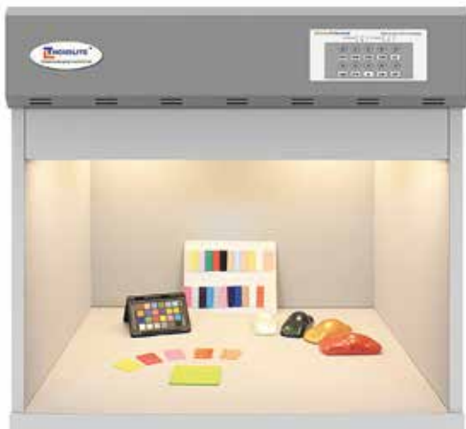
Thouslite LEDView Ultimate kabin

ítélésben a minta mérete is számít. Ezt a mintavételezésnél figyelembe kell venni.