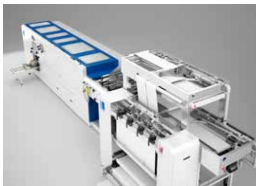
Kolbus WF 100

A rendszer nyomott ívekkel történő ellátásánál a Kolbus demonstrálni fogja ennek az alapelvnek a teljes rugalmasságát. A digitális tekercsnyomtatásnál a ragasztóköttő gépsort a WF 100 hajtogató aparát látja el. A maximális 1,5 millió oldal/órás teljesítményével a jelenlegi standardverzióban a Kolbus WF 100-nak megvan a potenciálja, hogy mai üzembe helyezéssel számos digitális nyomtatási technológiai generációt túléljen. A WF 100 semmilyen módon nem korlátozza be az utána kapcsolt továbbfeldolgozási folyamatot. Ragasztóköttetés, cérnafűzés, irkafűzés, perforáció, összeragasztás, mind lehetségesek. A kötészeti folyamatok csatlakoztatásához a Kolbus-megoldások