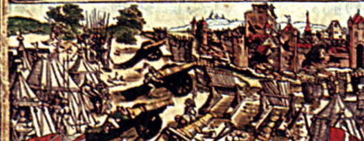
Albrecht Dürer: Részlet Miksa császár diadalkapuja című fametszetéből

Im krieg so er in gheldern fuert Dabey man noch sem manheit spuert Nanch ritterlichs plut verdros Wiewols sem widerfaul verdros Doch machte er sie pald stil vnd kam Das land genvaltighlich ein nam