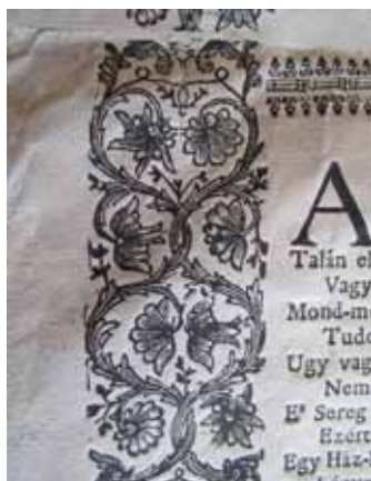
6. kép. És ugyanennek a kártának keretdísz

Úgy tűnik, hogy jellegzetesen erdélyi kiadvány típusal van dolgunk. E különleges nyomtatványokat először Herepei János rendszerezte, és az általa ismertekről rövid leírást készített. Közülük néhány 17. századi, többségük a 18. századból való. Egy időre azonban ez a több mint száz kárta feledésbe merült, mert a közönség számára csak a kolozsvári Farkas utcai templomban, a papi székek fölé kifüggesztett 12 kárta volt