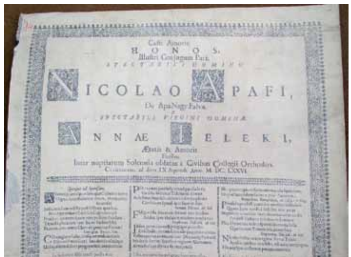
4. kép. Apafi Miklós és Teleki Anna esküvőjére (Kolozsvár, 1676) készült kárta felső része